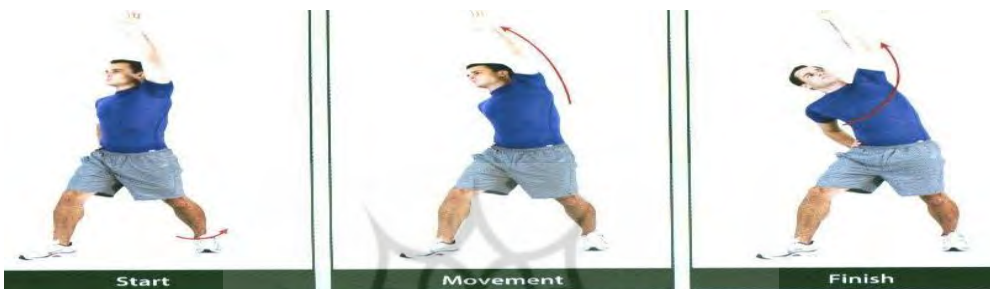
کشش عضله ایلئوتیبیال باند در حالت ایستاده