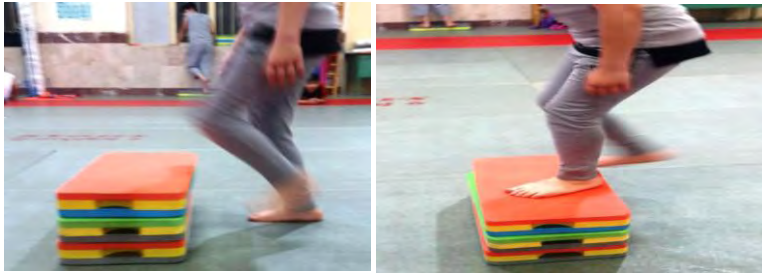
بالارفتن از پله و حفظ تعادل