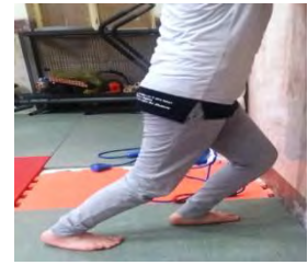
کشش عضله نعلی