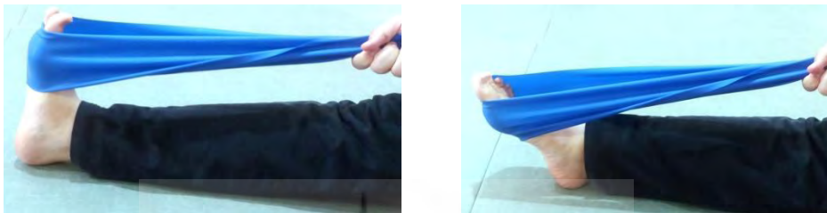
تمرین فعال سازی پلاتار فلکشن مفصل میچ پا در مقابل تراباند (کش پیلاتس)