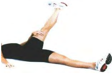
در حالت طاق باز