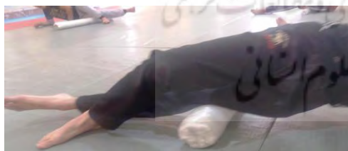
د. تمرین رهاسازی عضلات نوار ایلوتیبیال باند/ کشنده پهن نیام