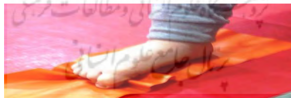
جمع کردن حوله زیر پا، کوتاه کردن پا (عضلات کف پا)