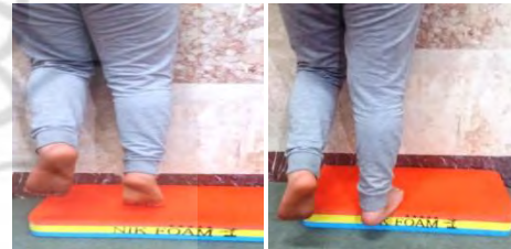
بلند کردن ساق یک پا روی لبه استپ و خم کردن زانو در مقابل مقاومت همراه با چرخش داخلی