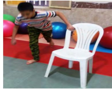
تمرینات تعادل ستاره