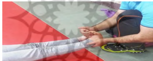
درحالت طاق باز با صاف بودن زانو در مقابل مقاومت دست دورسی فلکشن پا صورت می گیرد (ساقی قدامی)

پژوهشگاه علوم انسانی و مطالعات فرهنگی پرتال جامع علوم انسانی