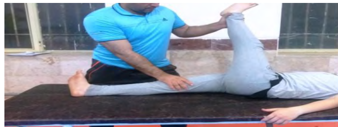
کشش تسهیل عصبی-عضلانی دوسر رانی