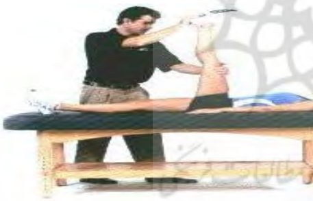
کشش تسهیل عصبی-عضلانی عضلات همسترینگ