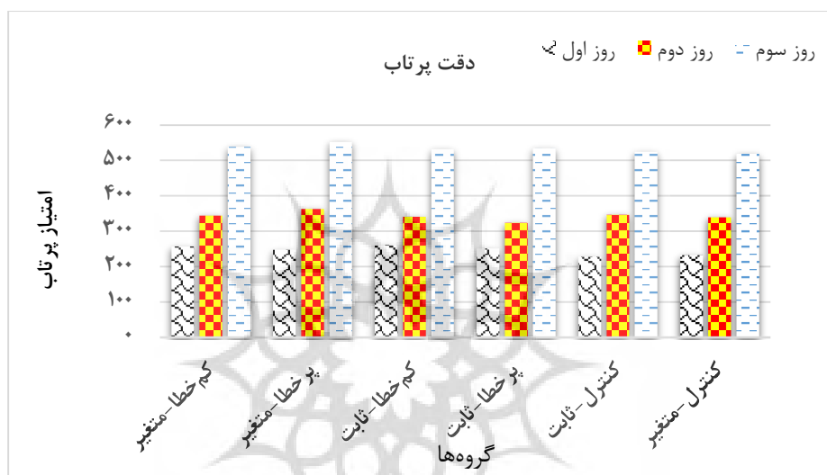
شکل ۲- میانگین امتیاز پرتاب در روزهای تمرینی

در شکل شماره دو امتیاز پرتاب شرکت کنندگان در روزهای تمرینی نشان داده شده است. همان طور که مشاهده می شود، گروهها در روز سوم نسبت به روز دوم و در روز دوم نسبت به روز اول امتیاز بیشتری کسب کرده اند؛ به عبارت دیگر، در حال اکتساب مهارت پرتابی هستند.