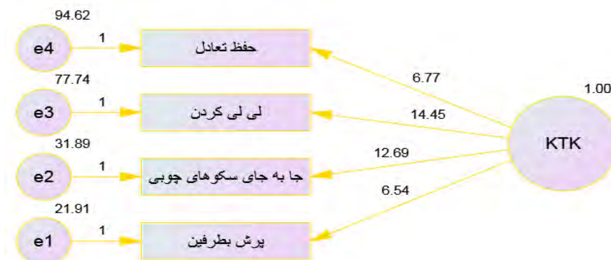
شکل ۱- مدل تحلیل عاملی تأییدی سازه آزمون KTK به همراه بارهای عاملی غیراستاندارد