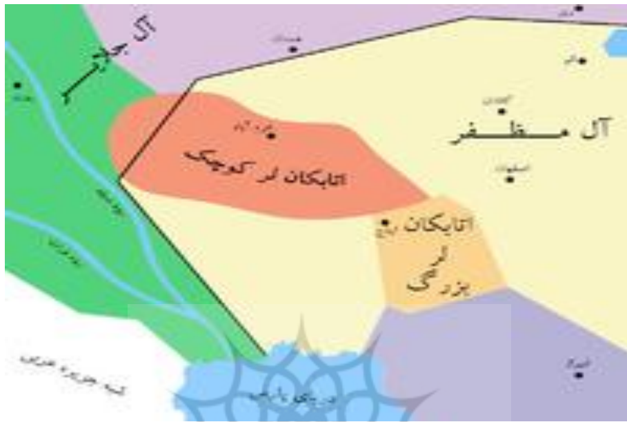
تصویر شماره ۲