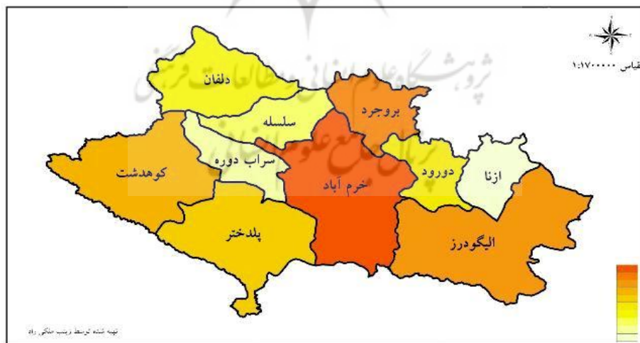
تصویر شماره ۱

می‌توان گفت در حیطه غیررسمی و نزد مردم، نام لرستان به تمام سرزمین‌های لرنشین، شامل استان‌های لرستان، چهارمحال و بختیاری، کهگیلویه و بویراحمد، و بخشی از استان‌های خوزستان، ایلام، فارس، و بوشهر اطلاق می‌شود، اما به‌طور رسمی، اداری، و سیاسی این نام تنها بر استان لرستان، به مرکزیت خرم‌آباد، اطلاق می‌شود که تنها شامل بخشی از سرزمین تاریخی لرستان و مناطق سکونت مردم لر است.