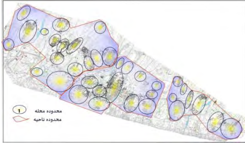
شکل ۴. ناحیه و محله‌بندی (۳۶ محله) شهر لامرد در وضع موجود