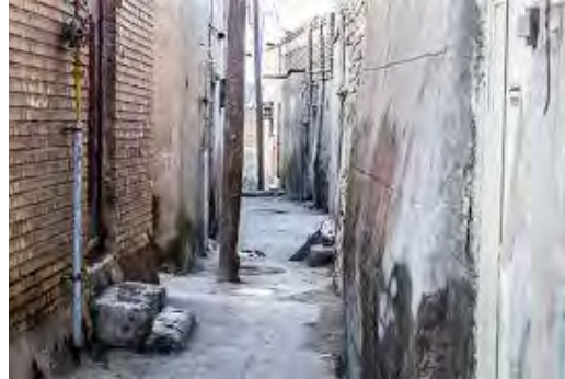
شکل ۵. تصویری از بافت فرسوده شهر لامرد در وضع موجود

موجود و ایجاد نظم و ترتیب بهینه در میان اجزای یک سیستم به‌گونه‌ای که در نهایت نیز کل نظام به‌سوی اهداف از پیش تعیین شده هدایت شود. به‌کارگیری این واژه برای یک منطقه را می‌توان در ابتدا شناخت کامل و سپس هدایت تدوین سیاست‌های موثر بهینه‌سازی عملکرد سازمان فضایی منطقه قلمداد نمود. برخی از این سیاست‌ها شامل ایجاد ساختار سلسله مراتبی مراکز و فضاها، تجهیز خدمات و تاسیسات زیربنایی، اصلاح راه‌های ارتباطی موجود و هدایت وضعیت فضاهای کالبدی در سکونتگاه‌های مرکزی می‌باشد (داداشی، ۱۳۷۵: ۶)