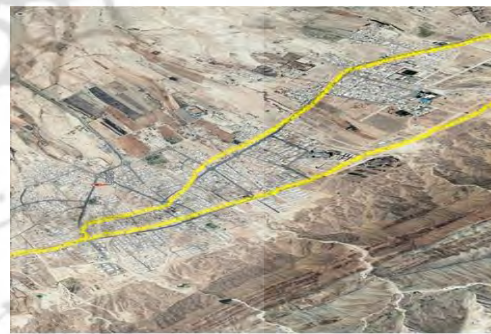
شکل ۲. هوایی شهر لامرد به طول ۱۲ کیلومتر (طول شهر ۱۲*۲/۵ کیلومتر)