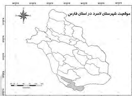
شکل ۱. موقعیت شهرستان لامرد در استان فارس

جمعیت شهرستان لامرد در سال ۱۳۹۵ برابر با ۹۱۷۸۲ نفر و جمعیت شهر لامرد برابر با ۲۹۳۸۰ نفر می‌باشد (سالاری سردری و همکاران، ۱۳۸۹). بررسی تغییرات جمعیتی شهر لامرد و مقایسه آن با سطوح فرادست نشان می‌دهد که نرخ رشد در این شهر، همواره نسبت به نقاط شهری کشور و استان و نیز شهرستان لامرد بیشتر بوده است.