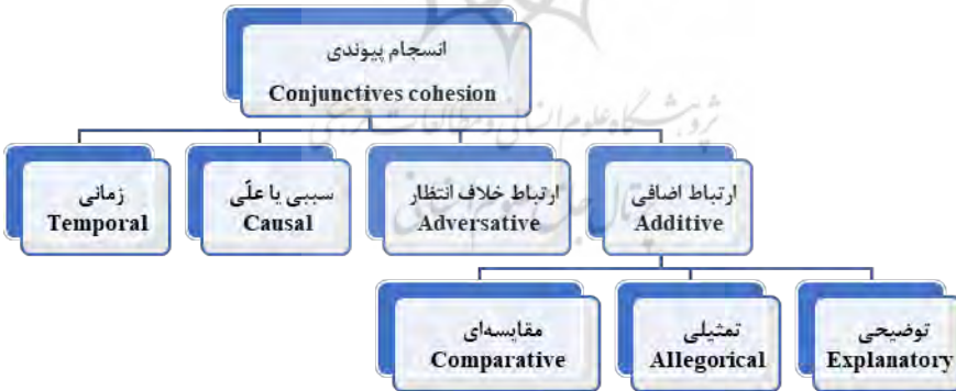
۴. نمودار عوامل انسجام پیوندی