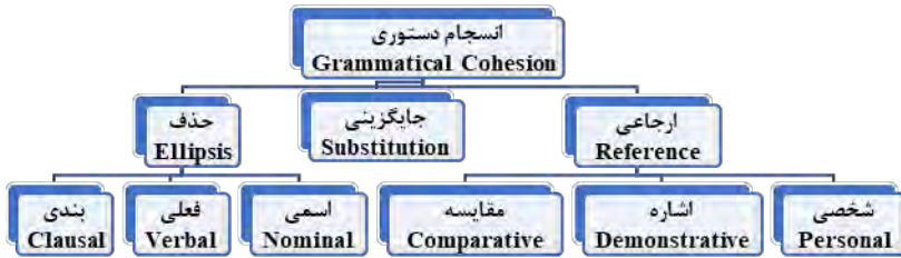
۲. نمودار عوامل انسجام دستوری