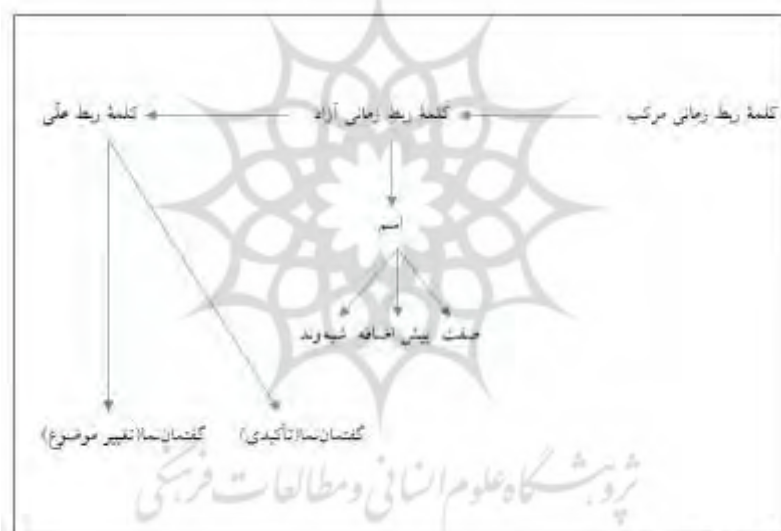
شکل ۲. نقشه معنایی «پس»

در نقشه معنایی تاریخی بالا (شکل ۲)، روابط دوری و نزدیکی نقش‌های متفاوت پس، در دوره‌های متفاوت فارسی (از فارسی باستان تا امروز) قابل مشاهده است. با پیکان‌ها