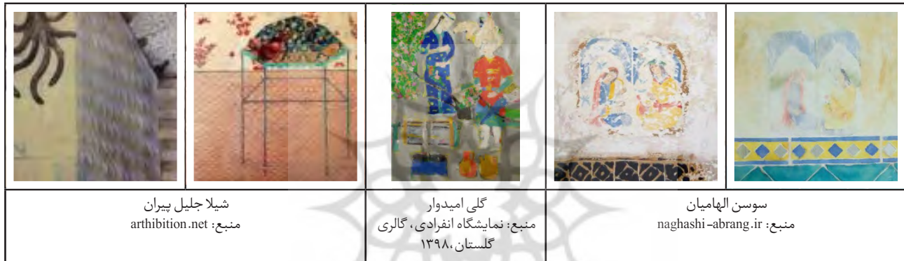
جدول ۸. دگرگونی ترکیب بندی نگارگری به شیوه معاصر. منبع: نگارندگان