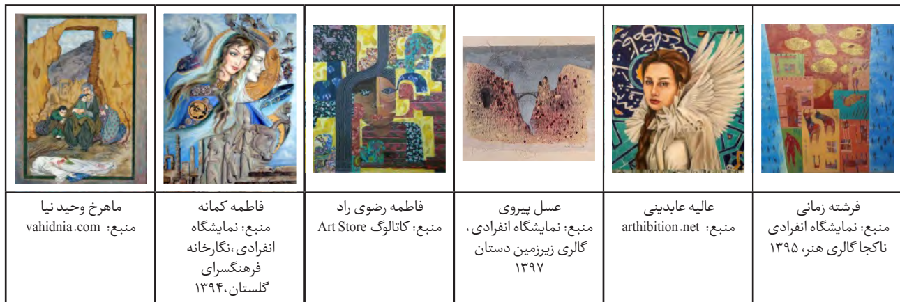
جدول ۹. جلوه‌های نگارگری معاصر در آثار زنان نقاش. منبع: نگارندگان