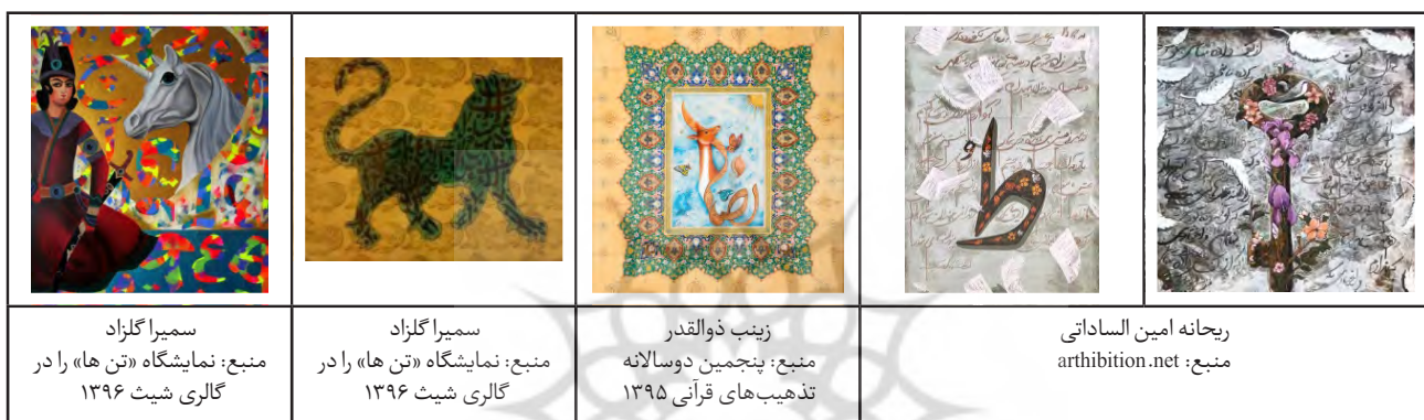
جدول ۶. کاربرد متن و حروف فارسی در نقاشی معاصر.