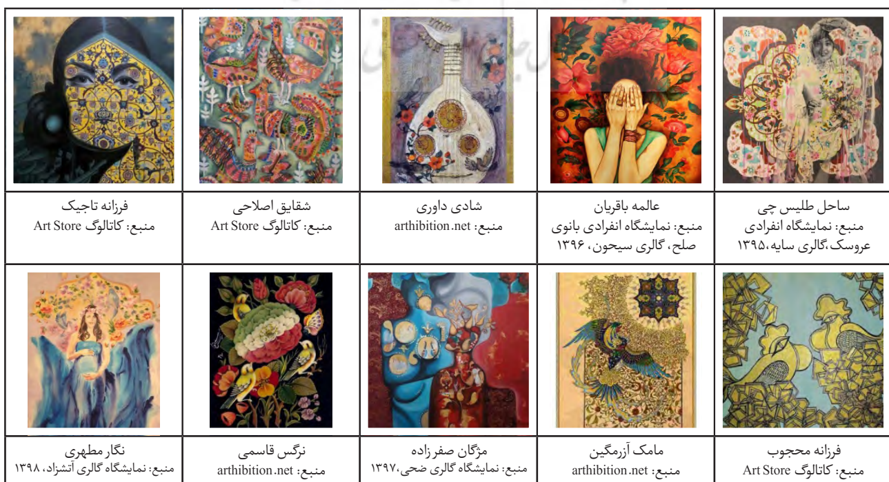
جدول ۷. تلفیق نقوش گیاهی و جانوری.