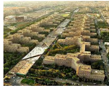
عکس (۱) - شهرک اکباتان تهران