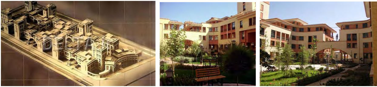
عکس (۲) - مجتمع مسکونی زیتون اصفهان