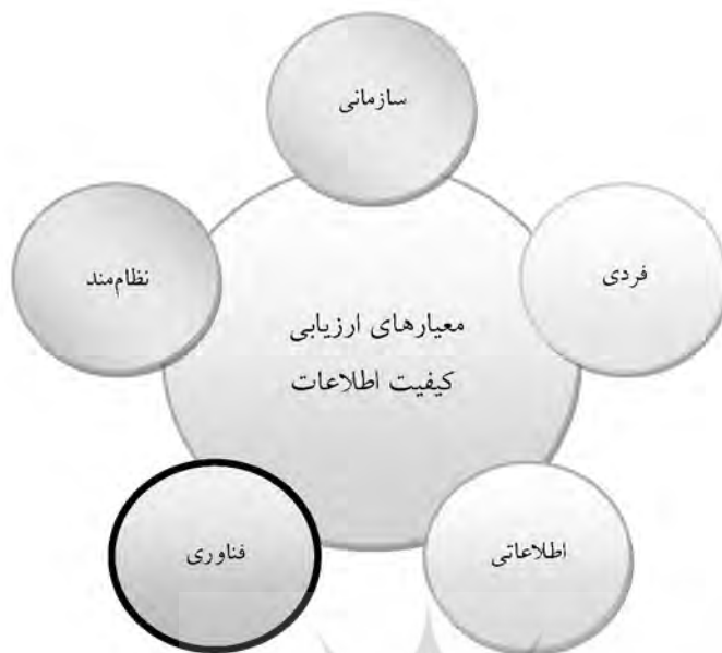
شکل ۲. معیارهای ارزیابی کیفیت اطلاعات در سامانه‌های اطلاعاتی مستندات فنی

تحلیل ۱۵ پژوهش منتخب، ۵ مقوله سازمانی، فردی، اطلاعاتی، فناوری، و نظام‌مند را شناساند.