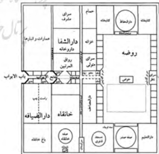
نگاره ۱: تعیین مکان دقیق فضاها در ربیع رشیدی مطابق وقف‌نامه

بی‌ت‌التعلیم؛ ۲- آموزش حرفه‌ای؛ ۳- مدارس عالی؛ ۴- دارالشفاء؛ ۵- خانقاه. در این وقف‌نامه مکان هر کدام از فضاهای مجموعه در وقف‌نامه آمده است (نگاره ۱). محل بیت‌التعلیم که محل تحصیل کودکان کارکنان ربیع و عده‌ای کودکان یتیم تبریز بوده است را خانه‌ای در روضه که بزرگترین خانهای روضه است بیان می‌کند و هر ۱۰ دانش آموز یک معلم داشته‌اند [همان، ۶۳] و یا در وقف‌نامه جایگاه حجره‌ها را نزدیک در خانقاه و جهت خانه‌های حفاظ معرفی می‌کند و بعضی دیگر را در بالای دارالشفاء، زیرزمین را در جنب گنبد و در برابر حمام توصیف می‌نماید [۲۲].