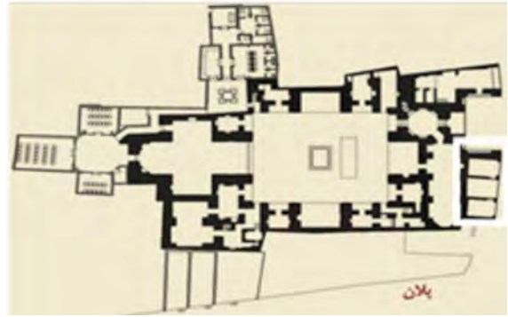
نگاره ۲ پلان مسجد مدرسه شفیعیه

به درون صحن و ایجاد اخلاص در زندگی آرام طلاب نباشند. در مدرسه شفیعیه نیز می‌توان دید که به ورودی به شبستان از هشتی است و نمازگزاران عمومی بدون وارد شدن به صحن، وارد شبستان می‌شوند (نگاره ۳).