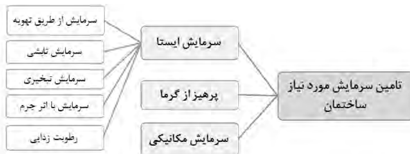
نمودار ۱) مراحل سه گانه تامین سرمایه گذاری ساختمان ها. [۲۵]

فرم و ساختار کالبدی بناهای سنتی، در کنار تامین عملکردها و نیازهای ساکنین، به عنوان یک سیستم سرمایه گذاری ایستا عمل نموده و در تامین سرمایه گذاری تابستانی نقش مهمی ایفا می کرده اند. در حال حاضر به دلیل تغییرات ایجاد شده در ساختار کالبدی بناها، شرایط زمانی و مکانی و... امکان استفاده از بسیاری از این سیستم ها در ساختمان ها وجود ندارد. با این حال می توان با بهره مندی از شرایط و امکانات موجود، به جای طراحی تک عنصر الحاقی، فرم پوسته ها و ساختار کلی بناها را به سمت ساختارهایی کارا از نظر میزان دریافت انرژی پیش برد.