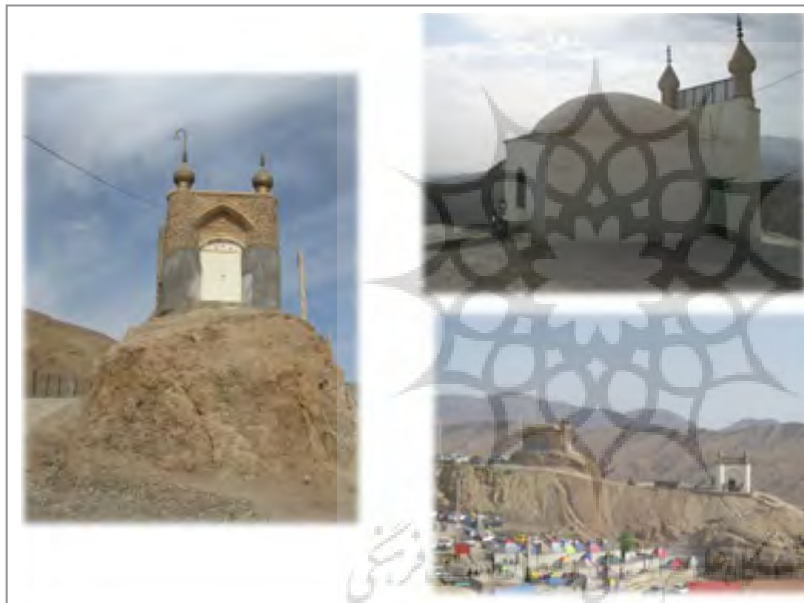
شکل ۴: چشم‌اندازی از عیار فرهنگی منطقه (وجود دو امامزاده در مجاورت منطقه)