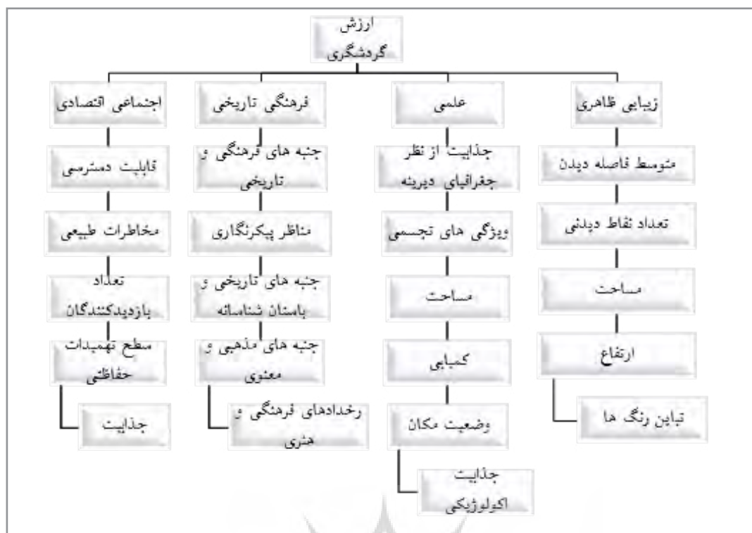
شکل ۱: معیارها و زیرمعیارهای عیار گردشگری

تاریخی و اجتماعی - اقتصادی. عیار گردشگری یک مکان از میانگین این چهار معیار به دست می آید و وزن هیچ کدام از جنبه های عیار گردشگری نسبت به دیگری کم یا زیاد نیست. عیار زیبایی ظاهری مکان به جنبه های دیدنی و تماشایی آن می پردازد. عیار علمی بر اساس معیارهای مثل کمپایی، جایگاه آموزشی... سنجیده می شود. در ارزیابی عیار فرهنگی بر جنبه های هنری و آداب و رسوم فرهنگی مکان تکیه می شود و در نهایت ارزش اقتصادی هر مکان بستگی به ویژگی های قابل بهره برداری و کارآفرینی آن در زمینه گردشگری و تفریح دارد (Mokhtari, 2012: 35). معیارها و زیرمعیارهای عیار گردشگری در شکل ۱ آمده است.