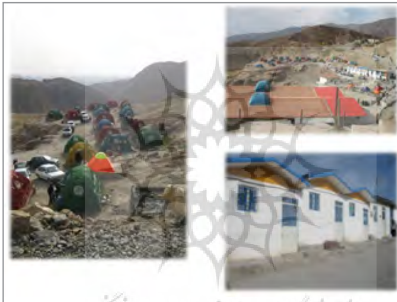
شکل ۵: چشم اندازی از میزان بهره‌وری از منطقه (امکانات اسکان بازدیدکنندگان)