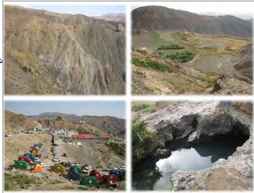
شکل ۳: چشم‌اندازی از عیار زیبایی منطقه و نواحی اطراف آن