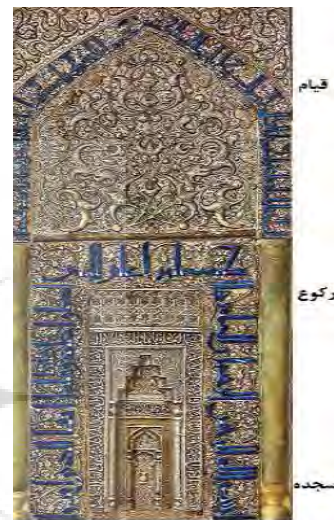
شکل ۶- انعکاس حالات اصلی نماز در طاق‌های سه‌گانه محراب

حرکت و روشنایی دل است. و در نهایت قوس کوچکتر نمادی از سجده است. سجده مشعر دل و مرحله شعور و آگاهی است. سبحان ربی الاعلی و بحمده، سجده غایت بندگی است و آغاز معراج اتصال حقیقی مؤمن به خداوند در لحظه سجده او روی می‌دهد. بر خاک می‌افتد، کوچک می‌شود اما این کرنش نمادی از عظمت اوست نمادی از رهایی، آزادی و پرواز به عرش ملکوت. هنرمند در بجهای را برای ورود او در محل سجده‌گاه وی قرار داده است، با قندیلی آویخته بر آن، منور به نور الهی. در این لحظه او پای در نردبان عروج می‌گذارد و خداوند نیز نور خود را در آغاز راه بر وی می‌تاباند. گویی هنرمند معنای فوق را در کلام الهی نیز بافته است. از این رو است که در انتهای محراب و نزدیک‌ترین مکان به سجده‌گاه مؤمن این آیه عظیم را می‌نگارد: يَا أَيُّهَا الَّذِينَ آمَنُوا اسْتَجِيبُوا لِلصَّوْتِ وَالصَّلَاةِ «ای کسانی که ایمان آوردید از صبر و نماز [در کارهای خود] جاری بجوید».