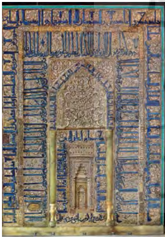
شکل ۱. محراب زرین‌فام پیش روی مبارک

این محراب در ساختار کلی دارای سه طاق‌نما، ستون‌نما و کتیبه‌هایی در اطراف آنها است و بر دور محراب نواری از کاشی فیروزه‌ای کشیده شده است (شکل ۱).