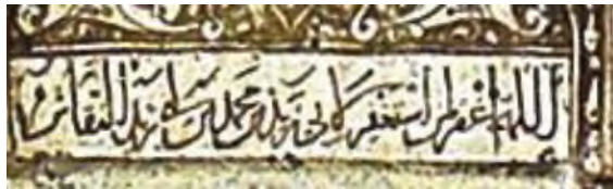
شکل ۹. رقم زید بن محمد بن ابی‌زید نقاش

واقعیت، به حقیقت و باطن امور دست یابد (Bolkhari Qahi, 2009b, 41- 42) و در این مسیر نیازی نمی‌بیند تا نام خود را آشکار نماید اگر هم نامی به‌میان می‌آورد آن را با القابی از سر خشوع و بندگی مزین می‌سازد تا باور خود را که همانا رسیدن به حقایق امور و بندگی در برابر ذات اعظم و هنرمند مطلق عالم است به سرانجام رساند.