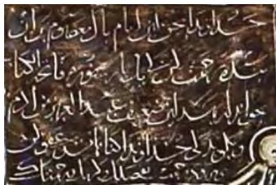
شکل ۷. رقم عبد العزیز بن آدم بانی محراب

و بگوید که خداوند گناهانش عفو کن و او را رحمت کن بفضلك و کرمک و رحمتک (شکل ۷).