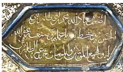
شکل ۸. رقم محمد بن ابی‌طاهر سازنده محراب (مأخذ: نگارندگان)

نام محمد بن ابی‌طاهر نیز در کتیبه فرعی دیگری در گوشه سمت چپ بر روی حاشیه دوم محراب (شماره ۶۱ در شکل ۳) به این مضمون است: أضعف عبداً لله محمد بن طاهر بنی الحسن زید بخطه بعد ما عمله و صنعه عَفَرَ اللهُ له و لجمیع المؤمنین و المؤمنات محمد و عتره الطاهرين (شکل ۸).