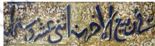
شکل ۲. رقم تاریخ ساخت در حاشیه پایین محراب

خط کوفی برجسته لاجوردی رنگ با آیه ۵۶ سوره احزاب، بر زمینه نقاشی‌شده زرین‌فام نیم‌برجسته قرار دارد. (۶) در میان این دو حاشیه، عبارت «لا اله الا الله محمداً رسول الله» به خط کوفی تزئینی آمده است. (۷) تاریخ ساخت محراب در کتیبه بزرگی در قسمت پایین محراب به خط ثلث برجسته با لعاب لاجوردی بر زمینه‌ای از اسلیمی‌های درهم پیچیده زرین‌فام این چنین نوشته شده است: «فی ربيع الآخر اثني عشر و ستمائة» (۸) (شکل ۴). در بالای این ماده تاریخ و در قسمت فرورفتگی زیرین محراب قسمتی از آیه ۱۵۳ سوره بقره آمده است. (۹) و در همین قسمت در سطحی افقی آیه اول سوره فتح، «انا فتحنا لک فتحا مبینا» ذکر شده است. (۱۰) طاق‌نمای بزرگی که بخش میانی محراب را دربرگرفته با اسلیمی‌های برجسته درهم گره‌خورده تزئین شده است و حاشیه قوس شکسته آن آراسته به آیه ۲۸۵ سوره بقره به خط کوفی برجسته لاجوردی است. (۱۱) در پایین این قسمت نیز حدیثی در ثواب زیارت امام رضا(ع) نوشته شده است که بخش عمده‌ای از آن از میان رفته است. (۱۲) محراب دو حاشیه پهن دارد. حاشیه خارجی آن آراسته به کتیبه‌ای با آیات ۱۱۴ تا بخشی از آیه ۱۱۶ سوره هود است که به خط کوفی برجسته و به رنگ لاجوردی بر زمینه نقاشی شده زرین‌فام نقش بسته است. (۱۳) نام بانی محراب، عبدالعزیز بن آدم، در میان این آیات به قلم ثلث خفی، به رنگ سفید لعاب اصلی زمینه آمده است. (۱۴) حاشیه دوم کتیبه‌ای شامل آیات ۱۴۴ و ۱۴۵ سوره بقره، به قلم ثلث برجسته به رنگ لاجوردی بر زمینه اسلیمی‌های نیم‌برجسته و نقاشی‌های زرین‌فام مسطح است. (۱۵) که در میان حروف این کتیبه در پایین سمت چپ، رقم محمد بن ابی طاهر به‌صورت: «ضعف عباد الله محمد بن ابی طاهر بن ابی الحسین زهد بخطه بعد ما عمله و صنع» باقی مانده است. (۱۶)