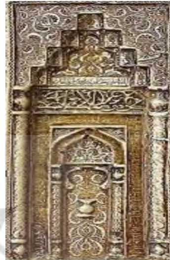
شکل ۴. طاق‌نمای دوم و سوم آراسته به مقرنس

نمادین این ستون‌نما و قوس‌ها را در انعکاس آرایه‌های اصلی مسجد، یعنی گنبد و مناره جستجو کرد (Rabiee, 2013, 288). محراب قلب یک مکان مقدس است و گویی همه‌چیز پیوندی عمیق با آن می‌یابد، همه‌چیز در مکان عبادت به محراب ختم می‌شود. ستون و قوس‌های رو به بالا تمثیلی از گنبد و مناره هستند و به حقیقی ورای این جهان خاکی دلالت دارند. آسمان و دست‌های نیایش نمازگزار به‌سوی آن، جمال و جلال الهی ۶ و رعب مؤمن در مقابل رب خود، معانی مندرج در این نمادها را شکل می‌دهند. محراب انسان را به معراج و عالمی دیگر هدایت می‌کند، «الصلوة، معراج المؤمن» ۷ .