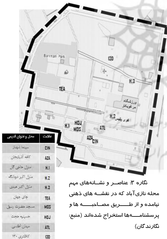
نگاره ۳: عناصر و نشانه‌های مهم محله نازی‌آباد که در نقشه‌های ذهنی نیامده و از طریق مصاحبه‌ها و پرسشنامه‌ها استخراج شده‌اند

محله در گذشته خیلی سگ ولگرد داشته است و عناوین قدیمی چون خیابان شهزاد، شقایق (رحیمی)، کوشا (خداشرفی)، بوعلی شمالی (نیکنام)، کوچه درختی.