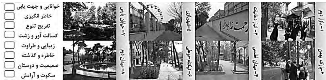
نگاره ۴: تصاویر منتخب و کیفیات مورد سنجش از شهروندان پیرامون تصاویر