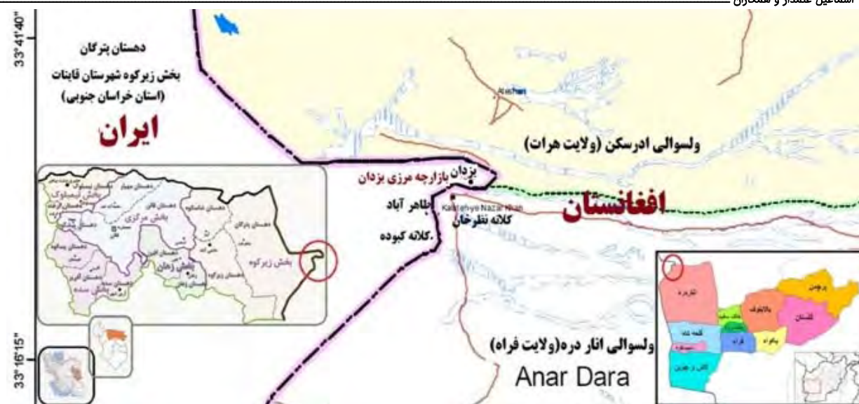
نقشه ۲) نقشه موقعیت جغرافیایی سکونت‌گاه‌های یزدان و کبوده و نظرخان در ایران و افغانستان امروزی (منبع: نگارندگان)