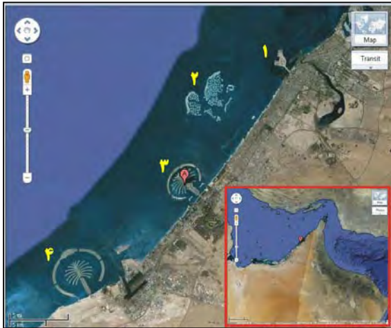
شکل ۱) جزایر مصنوعی امارات متحده عربی [25] ؛ به ترتیب از شماره ۱ تا ۴: جزیره نخل دیره، جزایر جهان، جزیره جمیرا، جزیره جبل علی

دریایی خلیج فارس را در نظر بگیرد. هر گونه بی‌توجهی به ملاحظات محیط زیست خلیج فارس و عدم اعلان و آگاهی به سایر کشورها، دستاویزی حقوقی برای ممانعت از احداث این گونه جزایر است (شکل ۱؛ نقشه ۲).