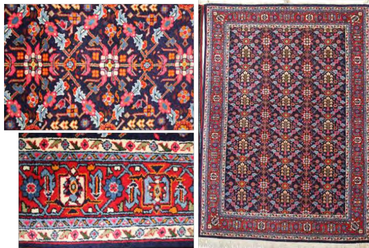
تصویر ۵: طرح و نقشه ترمذ، مجموعه مهاجرانی (پژوهش گر، ۱۳۹۸)