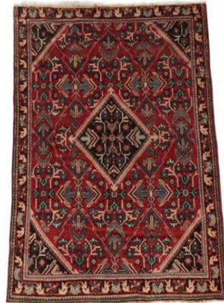
تصویر ۱۱: لچک و ترنج لوزی، محل (www.pinterest.com)