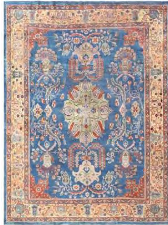
تصویر ۳: قالی‌های زمینه آبی فراهان و ساروق