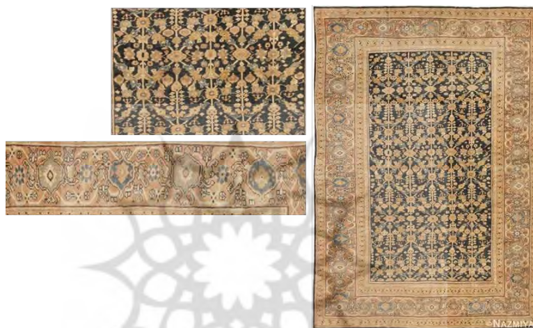
تصویر ۶: طرح و نقشه ترمذ (www.thpix.com)