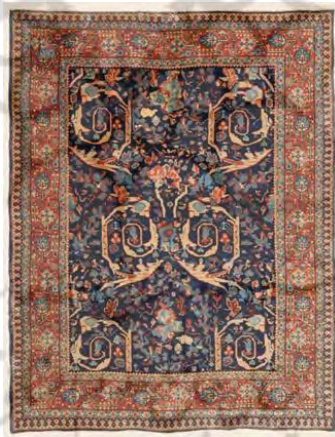
تصویر ۱۳: طرح مستوفی، بافت تبریز، حدود ۱۹۱۰ میلادی (www.claremontrug.com)

یکی از نقشه‌های رایج که در مناطق (محل‌های) مختلف اراک بافته می‌شد، طرح و نقشه مستوفی بود. این طرح هم‌اکنون نیز در بسیاری از روستاهای اطراف اراک و فراهان بافته و عرضه می‌شود. البته نه به صورت نقشه قدیم و اصیل بلکه با تغییر و تحول در ساختار طرح و نقش و رنگ‌بندی. خاستگاه طرح مستوفی محل تردید است. در ارتباط با آن دو روایت وجود دارد. نخست این که این طرح متعلق به مستوفی از ملاکین و شخصیت‌های بزرگ اراک است، در حقیقت به سفارش شخص ایشان، طرح مذکور طراحی و بافته شد. روایت دوم حکایت از اصالت قفقازی این طرح دارد که توسط مستوفی‌الممالک سیاست‌مدار دوره قاجر به ایران و اراک وارد و رایج شد. طبق شواهد به نظر می‌رسد که حکایت به واقعیت نزدیک‌تر است. از این رو که یکی از طرح‌های رایج و قدیمی که در مکتب بافندگی تبریز بافته می‌شد، طرح و نقشه مستوفی است که به احتمال زیاد و به لحاظ حسن هم‌جواری تبریز با منطقه قفقاز و آسیای میانه، به تبریز و نهایتاً توسط تجار و تولیدکنندگان تبریزی به منطقه اراک وارد شده‌است (تصویر ۱۳).