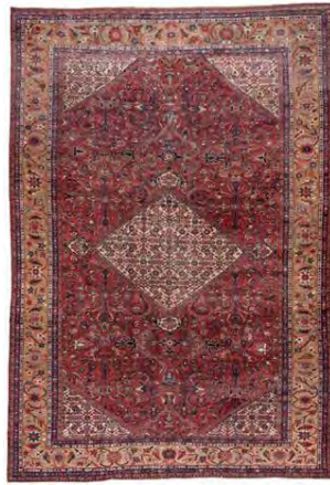
تصویر ۱۲: لچک و ترنج لوزی، محل (www.1stdibs.com)