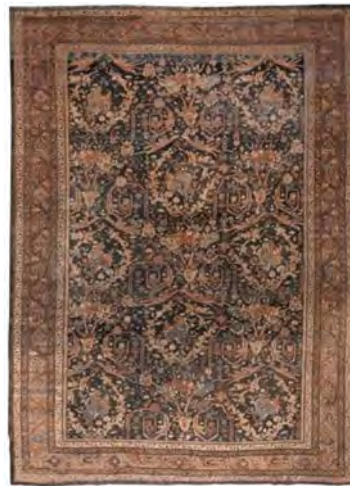
تصویر ۱۶ (راست) و ۱۷ (چپ): طرح مستوفی، بافت محل