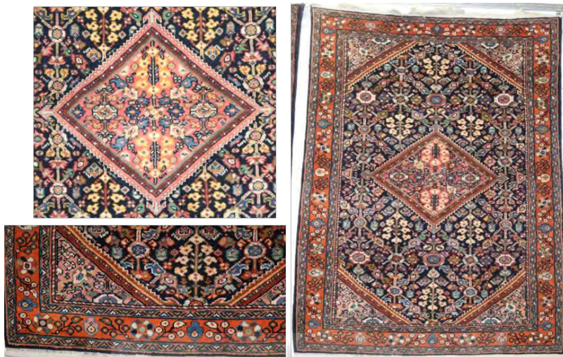
تصویر ۴: طرح و نقش قدیم گل‌حنا، مجموعه پیرعلی (پژوهش گر، ۱۳۹۸)

دوغی است و رنگ زمینه قالی سرمه‌ای رنگ. نقش‌پردازی در زمینه شامل شبکه‌ای از گل و بوته‌هایی انتزاعی است که به صورت لوزی‌گون بهم اتصال یافته است. درون هر لوزی نیز گل‌هایی نرگس‌گون نقش‌پردازی شده‌است. فضای زمینه پر نقش و متراکم است، زمینه سرمه‌ای رنگ و حاشیه قرمز روناسی است که با گذشت زمان مایل به نارنجی شده‌است و این ویژگی‌ها از مشخصات قالی‌های قدیم مشک‌آباد و فراهان است. افزون بر این ویژگی‌ها، رنگ دوغی و افسانه‌ای زمینه لچک‌ها هم قابل توجه است. طرح و نقشه گل‌حنا همواره در رج‌شمار ۲۰ تا ۲۵ و در ابعاد و اندازه ذرع و نیم بافته می‌شد.