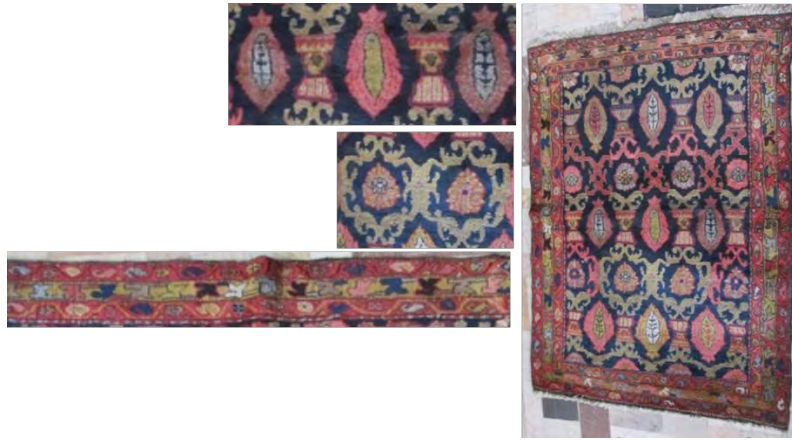
تصویر ۷: طرح و نقشه بازوبندی، مجموعه سیامک پیرعلی (پژوهش گر، ۱۳۹۸)