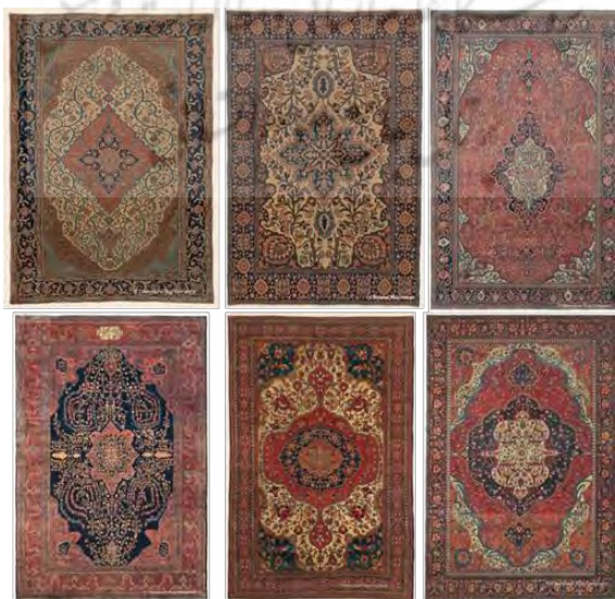
تصویر ۲: نمونه قالی‌های ساروق، بافت شرکت زیگلر، (www.pinterest.com)

این قالی‌ها تماماً از جنس پشم و در ابعاد ۱۲، ۱۳ (هفت ذرع)، ۲۴ و در ۴۰ متر تولید می‌شدند. رنگ‌های به‌کار رفته در این قالی‌ها به‌طور کامل گیاهی و فرآیند بافت تحت کنترل و مدیریت شرکت‌های سفارش‌دهنده بود است. متأسفانه از این نمونه قالی‌ها حتی یک تخته هم در ایران وجود ندارد. تعداد رنگ‌های به‌کار رفته در این قالی‌ها بین ۱۲ تا ۱۵ رنگ متغیر است. رنگ‌بندی در این قالی‌ها هوشمندانه و بر مبنای یک چنین خلاقانه و زیباشناختی به اجرا درآمده است. زمینه غالب آن‌ها از خانواده قرمز و خاصه قرمز روناسی است. چه این که رنگ آبی نیز در موارد بسیار، رنگ زمینه است. حاشیه قالی‌های کلاسیک ساروق بخش دیگری از بُعد دیداری و زیباشناختی آن است. حاشیه این قالی‌ها یا قرمز است و یا سرمه‌ای. البته نمونه‌های در دسترس بیش‌تر حاشیه‌ای سرمه‌ای دارند. قالی‌های زمینه آبی فرهان و ساروق در آمریکا و اروپا، از شهرت قابل توجهی در بین طرف‌داران آن، برخوردار بود. از این نمونه قالی‌ها (آبی آسمانی) و آبی لاجوردی فرهان و ساروق، صرفاً توصیفی در منابع برخی محققان دیده می‌شود (تصویر ۳). رنگ‌های قالی ساروق عبارت است از: قرمز، سرمه‌ای، زرد، دوغی، آبی کم‌مایه (آسمانی) و پرمایه (لاجوردی)، سبز سینجی و بشمی، قهوه‌ای باز و سیر، فیروزه‌ای (آبی و سبز)، نخودی، کرم، سفید و سیاه.