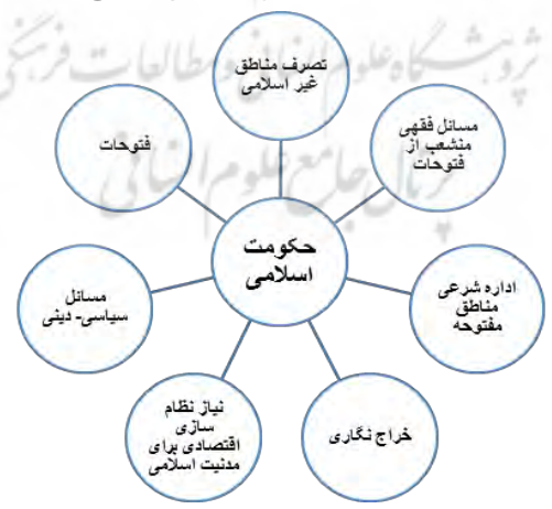
نمودار علل و زمینه‌های خراج‌نگاری

به این ترتیب خراج‌نگاری در چند سده نخستین هجری از یک طرف متأثر از عوامل مذهبی و دینی جامعه است. مسلمانان تحت تأثیر قرآن و سنت رسول الله ﷺ، آثاری در این زمینه تألیف کردند. از طرف دیگر عوامل سیاسی-اجتماعی جامعه اسلامی پس از فتوحات به ویژه در اداره شرعی سرزمین‌های مفتوحه، موجب نگارش آثار مالی و خراج‌نگاری شد.