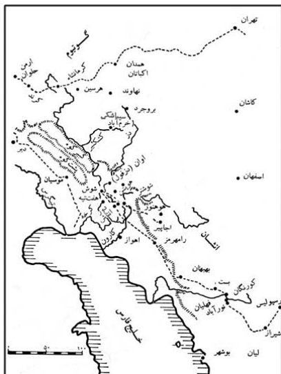
نقشه ۵= نقشه سرزمین سیماشکی