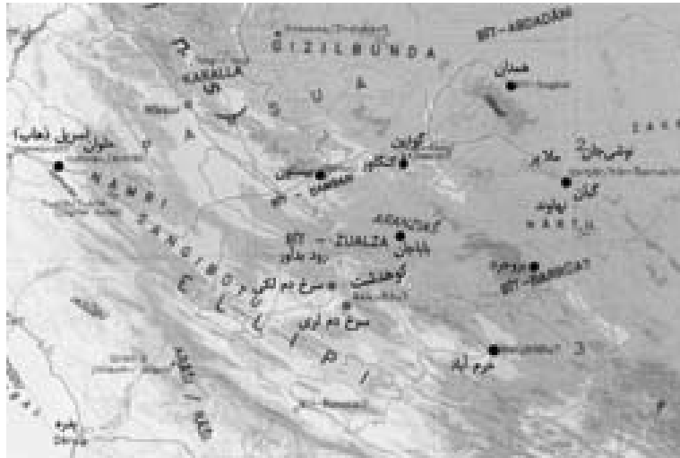
نقشه ۳= حوزه فرهنگی زاگرس مرکزی در اطلس آشور نو سده های ۸-۷ پ.م