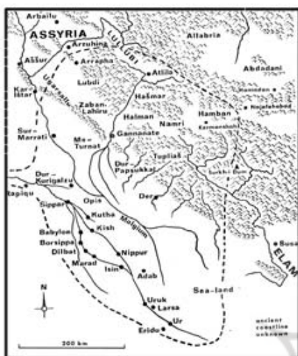
نقشه ۶ = نقشه سرزمین کاسی

پروژه شگانه علوم انسانی و مطالعات فرهنگی پرتال جامع علوم انسانی