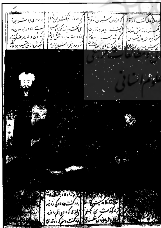
تصویر شماره ۳- کشته شدن دیو سپید به دست رستم

رستم و دیو در درون غار مشغول رزم هستند. این