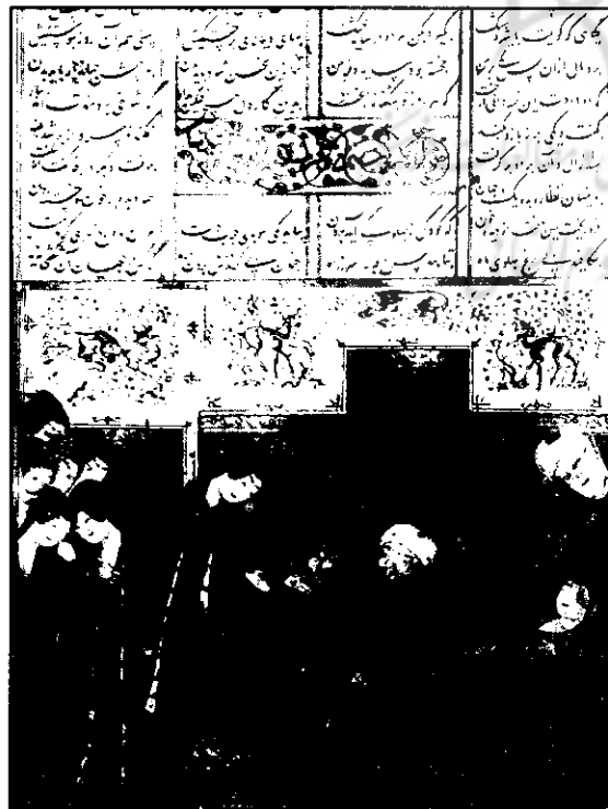
تصویر شماره ۵ - تولد رستم

یکی از داستان‌های زیبای شاهنامه، شرح احوال مادر رستم و چگونگی انجام عمل سزارین بر روی اوست که از تاریخ و احوال این عمل نزد ایرانیان حکایت می‌کند. داستان چنین است که وقتی زال شرح احوال طفل خود و