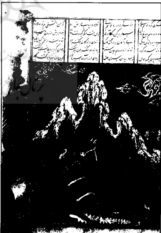
تصویر شماره ۱ کشته شدن دیو سیاه به دست شاهزاده هوشنگ

به راستی می‌توان این تصویر را نمونه‌ای ارزنده از این مجموعه بر شمرد، وضعیت ترکیب‌بندی به گونه‌ای است که علی‌رغم تمایل به قرینه‌سازی، ناگاه نگارگر با قرار دادن فرشته‌ای که به دیوی حمله می‌برد، در حاشیه تصویر، اصول قرینگی را در هم ریخته و به تصویر پویایی و حرکت می‌بخشد. به نظر می‌رسد که هنرمند نگارگر، تمایل زیادی