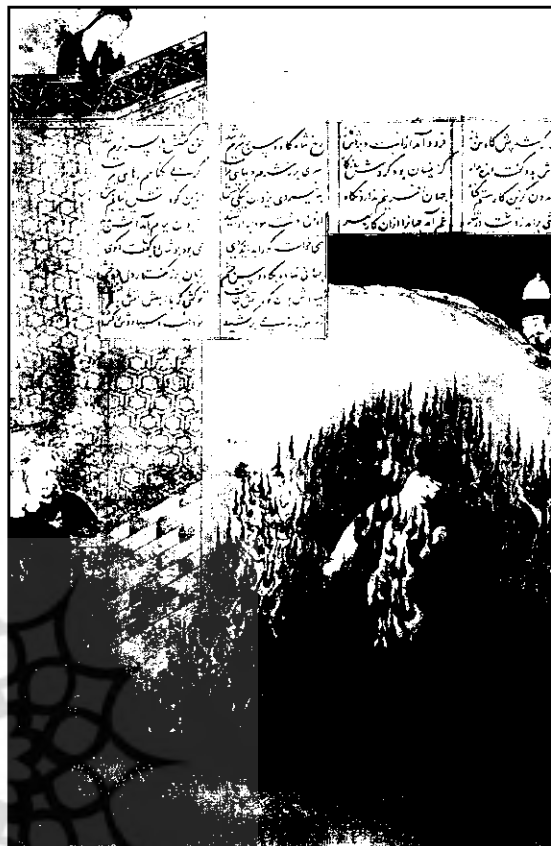
تصویر شماره ۴ - آزمون سیاوش با آتش

پاک را گواه بی گناهی و بی نیازی خویش می‌داند. (تصویر شماره ۴)