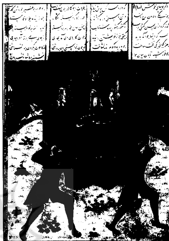
تصویر شماره ۲- دیوها، جمشید را بر تخت روانی حمل می‌کنند

بر پایه این روایت، نامادری سیاوش دل به مهر و عشق او می‌بندد، اما وی از پاسخ به دلدادگی نامادری خود سر باز می‌زند. از این رو، سودابه داستان را بر عکس به گوش کیکاووس شاه می‌خواند و از او می‌خواهد که سیاوش را تنبیه نماید، از آن زمان به بعد بدگمانی و بی‌قراری در سینه شاه بیشتر و بیشتر گردیده تا آن که دستور می‌دهد جهت آزمودن سیاوش، آتشی بی‌فروزد و هرمی از آتش بر پا کنند که سیاوش از آن گذر کند. اما سیاوش با لبی خندان و دلی مالمال از عفت و پر از مهر با اسب خود از آتش می‌گذرد و سلامت بیرون می‌آید. از سیاوش باید به عنوان سمبل و اسطوره عفاف و پاکدامنی نام برد که دادار