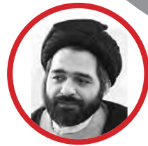
سیاست‌گذار آینده *

حوزه‌های علمیه در همه ادوار و زمان‌ها، پاسخ‌گوی نیازهای جامعه مؤمنانه بوده و هدایت جامعه به سوی سعادت را عهده‌دار بودند و گرچه در زمان‌های گذشته، حوزه‌ها، به خاطر اقتضائات زمانه، متصدی پاسخ‌گویی به نیازهای فردی مؤمنان بوده و توقعی از آن‌ها جهت سوق دادن جامعه به سوی ارزش‌های سیاسی-حکومتی دین اسلام، نمی‌رفت، لکن با پیروزی انقلاب اسلامی و تحقق حکومتی براساس ارزش‌های اصیل دین اسلام، با محوریت فقه شیعه و رهبری فقیه جامع‌الشرایط، سطح انتظار از حوزه علمیه توسعه یافته و پشتیبانی و حمایت از انقلاب اسلامی به مثابه چکیده ارزش‌های اسلام حداکثری (سیاسی، حکومتی) از وظایف اصلی علمی، عملی حوزه و روحانیت شیعه محسوب می‌شود.