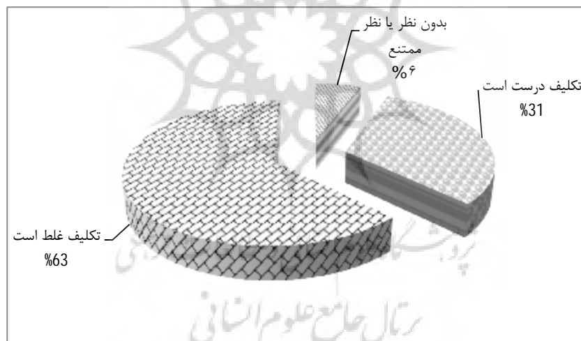
نمودار 1. تحلیل پاسخ‌های معلمان درباره درست یا نادرست بودن تکلیف ارائه‌شده

در تحلیل استدلال‌های معلمان درباره چرایی نادرست بودن این تکلیف نیز مشخص شد که تقریباً 100% (84 نفر از 86 نفر) معلمان که این تکلیف را نادرست می‌دانستند، علت آن را، تقسیم نشدن نوار