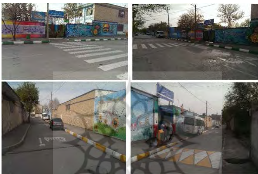
شکل ۷- ایمنی و سهولت تردد محدوده دبستان شهید مزیبانی و مرضیه مدرسی، کوی کارمندان اول، محله ی کوی کارمندان، منطقه ۶

در زمینه ایمنی و سهولت تردد با توجه به شکل ۷، منطقه ۶ از ایمنی و سهولت تردد مناسبی برخوردار میباشد. به طوریکه نه تنها از خط کشی عابر پیاده برخوردار بوده، بلکه با علایم راهنما مثل حرکت آهسته، ایست؛ به کاهش سرعت حرکت اتومبیل ها در نزدیکی مدارس کمک می کند. همچنین یافته های کمی مبنی بر میانگین شاخص ایمنی و سهولت تردد در منطقه ۶ که ۳/۱۴ بوده است تایید کننده ی وضعیت قابل قبول این شاخص میباشد. هرچند به طور کلی تا ایده آل فاصله وجود دارد؛ اما نتایج مشاهدات میدانی نشان دهنده ی وضعیت قابل قبول این شاخص در منطقه ۶ نسبت به دو منطقه ی دیگر (۱ و ۸) می باشد.