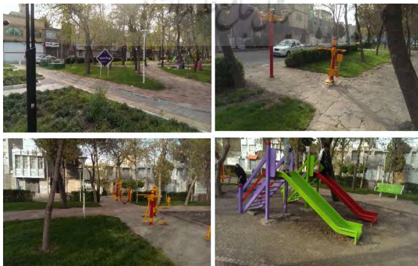
شکل ۶- بوستان مریم کوی کارمندان اول، محله کوی کارمندان، منطقه ۶ شهرداری مشهد

در منطقه ۶ که ۴ بوستان شناسایی شده است به طور کلی وضعیت فضاهای بازی و سبز متوسط و بعضاً ضعیف ارزیابی می شود، به طور کلی در شکل ۶ وسایل بازی فاقد استاندارد و تنوع می باشند. در بوستان افرا و افاقیا نیمکت جهت نشستن موجود نیست و یا نیمکت بدون وجود پشتی و فاقد استاندارد است. و یافته های کمی با توجه به پایین بودن میانگین این شاخص در منطقه ۶ ( 2/37 ) تایید کننده ی ضعف این شاخص در منطقه ۶ شهرداری مشهد می باشد.