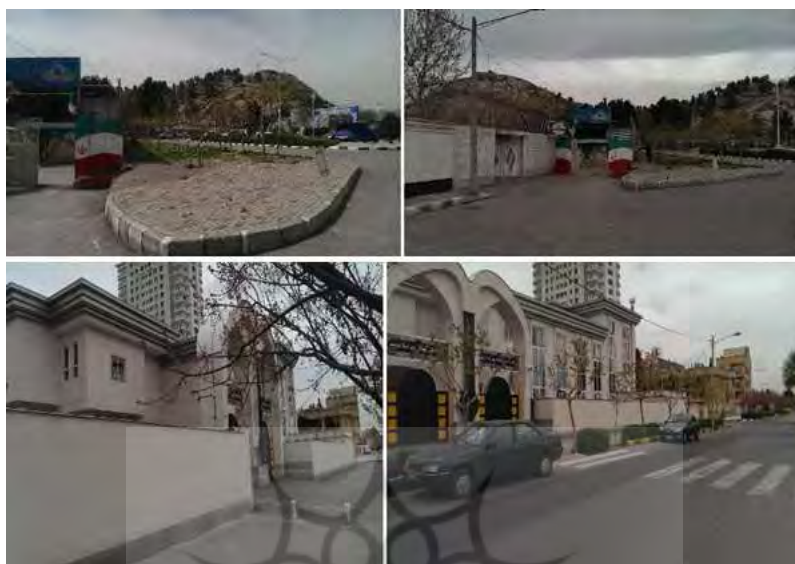
شکل ۳- ایمنی و سهولت تردد محدوده ی دبستان الغدير و دارالقرآن امام رضا، محله کوهسنگی، منطقه ۸ شهرداری مشهد

کمی نیز نشان دهنده ی این است که ایمنی و سهولت تردد در منطقه ۸ با میانگین ۳/۰۷ در مرز متوسط قرار دارد و با وضعیت ایده آل فاصله وجود دارد.