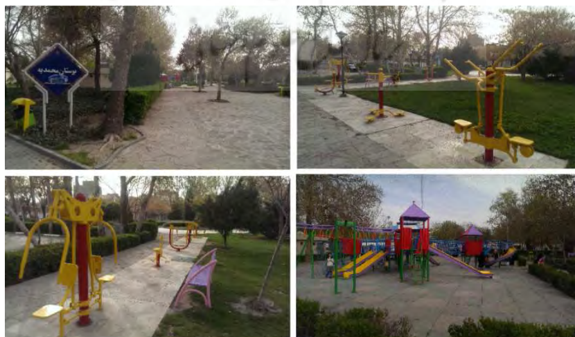
شکل ۴- بوستان محمدیه، محله ی احمدآباد، منطقه ۱ شهرداری مشهد

شکل ۴ بوستان محمدیه در محله ی سعدآباد را نشان می دهد که پارک ها از وسعت مناسب، وسایل ورزشی، وسایل بازی با کیفیت و استاندارد، نیمکت های مناسب و پوشش گیاهی مناسب برخوردار است. اما تنوع وسایل بازی زیاد نیست. غالباً وسایل بازی در پارک ها از جنس پلی اتیلن و استاندارد بوده و کفپوش ها مسطح و نرم است. همچنین پوشش گیاهی، درختکاری و گلکاری نیز مناسب است این در حالی است که یافته های کمی در زمینه ی فضاهای بازی و سبز در منطقه ۱ بیانگر پایین بودن میانگین این شاخص می باشد، به طوریکه از حد متوسط نیز کمتر است ( ۲/۸۷ ) و بین وضع موجود و مطلوب شکاف بارزی از منظر این شاخص نه تنها در منطقه ۱، بلکه در دو منطقه ی دیگر نیز وجود دارد.