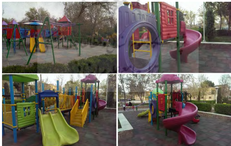
شکل ۲- وسایل بازی در پارک کوهسنگی، محله ی کوهسنگی، منطقه ۸ شهرداری مشهد

در این بخش از محدوده ی مورد مطالعه (در مناطق ۱، ۶ و ۸ شهرداری مشهد) به بررسی و تحلیل مستندات میدانی پرداخته می شود. با توجه به محدودیت در برداشت میدانی از کل مناطق، در هر منطقه یک محله به صورت هدفمند بر اساس دسترسی به مدارس، پارک و فضای سبز و محل بازی کودکان انتخاب شده است. در منطقه ی ۱ محله ی احمدآباد، منطقه ی ۸ محله ی کوهسنگی و منطقه ی ۶ محله ی کوی کارمندان مورد بررسی قرار گرفته است، تصاویر مربوط به پارک کوهسنگی منتخب در محله ی کوهسنگی منطقه ۸ نشان دهنده وسعت پارک، دسترسی مناسب به پارک محله ای، کیفیت و تنوع در وسایل بازی و همچنین قرارگیری مبلمان در محل بازی کودکان و امکان نظارت مستقیم والدین نشان دهنده ی تامین امنیت فضای بازی می باشد. همانطور که در شکل ۲ نشان داده شده است تنوع رنگی و روان شناسی استفاده از رنگ های گرم و سرد در وسایل بازی مناسب و مطابق استانداردها است. از سوی دیگر یافته های کمی وضع موجود در منطقه ۸، بیانگر پایین بودن میانگین شاخص فضاهای بازی و سبز (۲/۷۶) از دیدگاه والدین بوده است که این امر در مواردی مثل عدم اتصال به برق اضطراری در پارکها، عدم رسیدگی منظم به وسایل بازی، فرسودگی تاب ها و... بوده است و نتیجتاً بین وضع موجود و مطلوب شکاف وجود دارد.