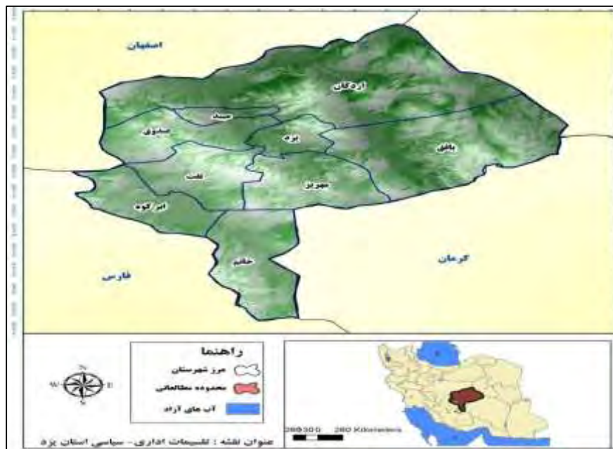
شکل ۱: محدوده مطالعه، استان یزد.