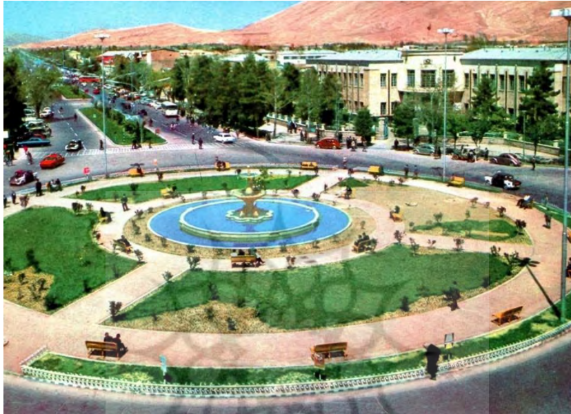
شکل ۴- میدان شهرداری شیراز

میدان شهرداری یا شهدا یکی از میدان های جدید شیراز محسوب می گردد که در ساخت و سازهای دوران پهلوی ساخته شده و به واسطه ساختمان شهرداری مرکزی یا بلدیة قدیم به این نام معروف شده است. در زمان قدیم و در دوران زندیه، تاسیسات زندی در این قسمت قرار داشته که در دوران قاجار و پهلوی به مرور تخریب و به این شکل درآمده است. با تاسیس شهرداری یا بلدیة قدیم، نام این میدان کم کم به میدان شهرداری تبدیل شد.