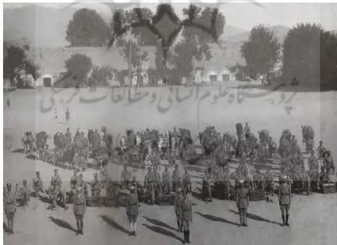
شکل ۲- میدان توپخانه شیراز