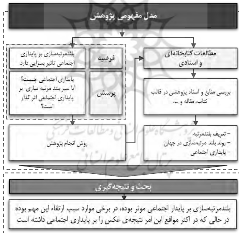
دیگرام ۱. مدل مفهومی پژوهش (نگارندگان، ۱۳۹۹)

این پژوهش از نوع تحلیلی-توصیفی است که با هدف بررسی مولفه‌های موثر بر پایداری اجتماعی کاربران ساختمان‌های بلندمرتبه انجام شده است، به این ترتیب که چهارچوب نظری با استفاده از مطالعات کتابخانه‌ای و اسنادی، در پی تبیین مفهوم پایداری اجتماعی و بلندمرتبه‌سازی تبیین شده است، لذا با فرض آن که پایداری اجتماعی و دست‌خوش تغییر و تحول قرار گرفتن آن ما به ازای تحول در ساخت علی‌الخصوص ساختمان‌های بلندمرتبه بوده است، به دنبال شناخت مولفه‌های موثر خواهد بود، در ادامه مدل مفهومی پژوهش به منظور تصویر کلی از روش انجام پژوهش می‌آید.