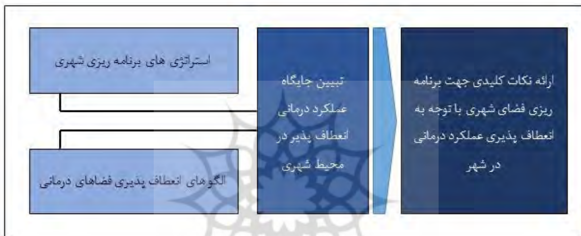
دیاگرام شماره ۱- روند انجام پژوهش حاضر