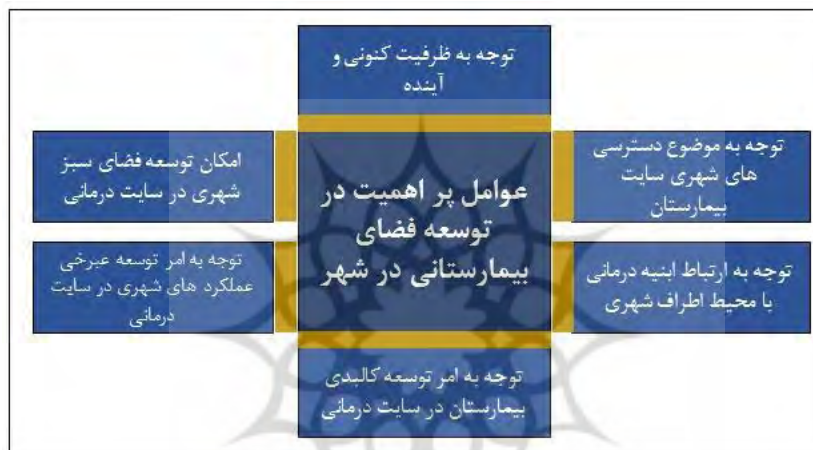
دیاگرام شماره ۳-۵: عوامل موثر در توسعه فضای بیمارستانی در شهر (منبع: نگارنده)