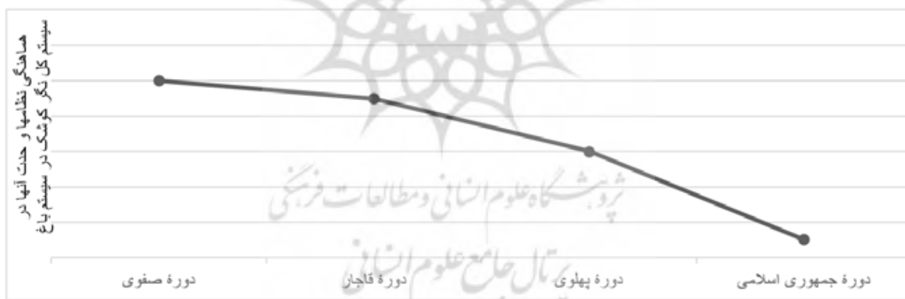
تصویر ۶. نمودار افزایش افت کیفی منظر کوشک در کناره‌گیری از سیستم کل نگر در ازای جزءنگری در ادوار مختلف.