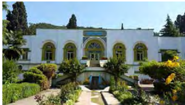
تصویر ۴. وضعیت فعلی کوشک پهلوی که امروز تغییراتی اساسی در ساختار جداره بیرونی آن ایجاد نشده است.

پدیدارشناسی نظام‌های کوشک در دوره صفوی نشان از وجود نگرش سیستمی و کل‌نگر به کوشک در سیستم باغ شاه دارد. نقطه عطف تحولات اساسی نابه‌جای کوشک در دوره پهلوی بوده و پس از آن شتاب گرفته است. با ورود مدرنیسم و اندیشه‌های آن، از معماری نئوکلاسیک در مرمت و بازسازی از آن‌گوبرداری شد که موجد ناهماهنگی با سیستم کوشک در بستر کلیت واحد باغ بوده است. در این وهله دیدگاه کل‌نگر و سیستمی کوشک شکسته شده است. جزءنگری به نظام‌های کوشک، گسست و عدم انطباق لایه‌های نظام‌های باغ در تشکیل یک کل واحد و همچنین ضعف ارتباط میان آنها در سیستم کوشک و باغ موجب ضعف و آسیب منظرش شده است. گسست نظام‌های کارکردی، کالبدی، تمرکز حواس، معنایی، ذهنی و زیبایی در کوشک، به‌عنوان بخشی از سیستم باغ، کوشک را به عنصری وصله‌شده به باغ مبدل کرده است. زیرا یک سیستم کل‌نگر به مجموعه‌ای از گسست‌ها مبدل شده است. گاهی تغییرات نابه‌جای جزءنگر، علی‌رغم عدم هماهنگی نظام‌ها با هم در سیستم در راستای هدف، با هم در تعارض قرار گرفته و در سیستم اختلال ایجاد کرده است. تقلیدهای مغایر با هویت کوشک و زمینه، و ورود سلیقه‌های متفاوت در نظام‌های مختلف و خارج از محیط سیستم و تحولات نابه‌جا از چالش‌های نگاه جزءنگر، سطحی و ابژکتیو است.