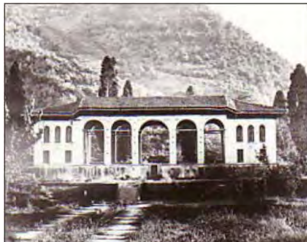
تصویر ۳. وضعیت کوشک در دوره قاجار.

و هویت بنا، فدای عملکرد و رفاه می‌شد. در چنین دورانی، بخش اعظم مجموعه برای رفاه بیشتر کاربران تغییر یافت یا نابود شد (منصوری رودکلی و همکاران، ۱۳۹۵، ۴۶). تحولات و آسیب‌های وارد بر نظام‌های سیستم منظر کوشک (تصویر ۴) در این بحران در جدول ۲ آمده است. نظام کالبدی و مفهوم زیبایی از سیستم کوشک گسسته شده و در پی معرفی زیبایی‌یابنده و دستاورد انسانی، با فاصله گرفتن از کل هدفمند باغ، استقلال پیدا کرده‌اند. همین عوامل همراه کاهش تعامل با منظر باغ تضعیف نظام حسی را منجر شده است. در حالی که در سابق نظام‌ها در ارتباط و مکمل با هم، در یک سیستم کل‌نگر، معنا می‌گرفتند. دستاورد این نگرش جزءنگر سطحی ورود سلیقه‌های مغایر با هویت و سیستم کوشک بوده است.