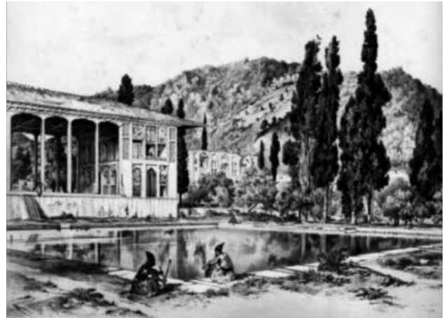
تصویر ۲. تغییرات ساختاری ستاوند و امتداد دید در کوشک باغ شاه.

با نظام‌های دیگر، تلفیق و وحدت با طبیعت و نظام باغ و همچنین سازگاری با طبیعت چنین تأثیراتی را در پی دارد: کیفیت معماری کوشک خلوتی مطلوب و کیفیتی دعوت‌کننده به تأمل، غور و اندیشه در انسان ایجاد می‌کند. این کیفیت مسبب خودارزیابی شخصی است که گام‌های بعدی خودشکوفایی فردی و جمعی و بهداشت روان را تأمین می‌کند (شاهچراغی، ۱۳۹۵، ۱۷۰-۱۷۱). بهره‌گیری از نیروهای شفافبخش طبیعی معجزه‌ای در سلامتی، رشد و درمان انسان محسوب می‌شود (کتلر، ۱۳۹۷). انرژی‌های طبیعی در حالت الکترومغناطیس بدن تأثیر مثبت می‌گذارد (رضایی‌مود، ۱۳۸۳، ۲۶-۳۱). از سویی افرادی که تجربه بیشتری از ارتباط با طبیعت را دارند، احساس قدرت و استعداد بیشتری کسب می‌کنند (Selhub & Logan, 2012, 11).