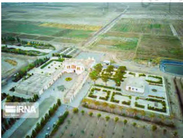
تصویر ۱. باغ فتح‌آباد کرمان بعد از مرمت و بازگشایی، مأخذ: www.Irna.ir

۱. خیابان اصلی با ورودی و کوشک اصلی در دو سر آن که با درختان کاج و سرو، جوی‌هایی در دو طرف خیابان و حوض‌هایی در وسط محور خیابان در نهایت دقت کار و تزئین شده‌اند. دید و منظر کوشک اصلی به سمت این خیابان در نظر گرفته شده است. کرت‌های کناری خیابان اصلی در سمت غرب نیز در این بخش از باغ قابل تقسیم‌بندی است. درواقع می‌توان گفت این بخش از باغ نقش باغ بیرونی یا عمومی مانند اتفاقی که در باغ دولت‌آباد یزد و یا جهان‌نمای شیراز افتاده بوده است را برای باغ فتح‌آباد دارد (بنگرید به پیرنیا، ۱۳۷۳). نقش قنات و شبکهٔ تقسیم