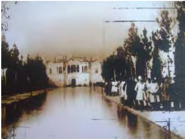
تصویر ۴. نخستین تصویر از باغ فتح‌آباد در دوره قاجار که ردیف درختان در محور اصلی باغ را نشان می‌دهد.