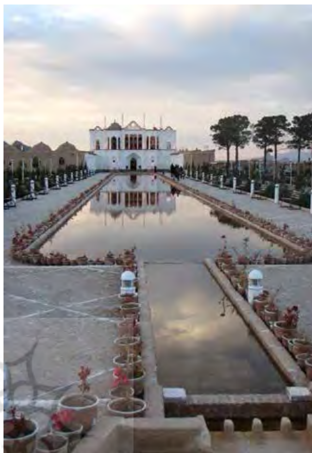
تصویر ۶. کوشک اصلی باغ فتح‌آباد در انتهای محور اصلی باغ.

میان اصلی‌ترین پیوندها، باغ فتح‌آباد به باغ ایرانی با توجه به شاخص‌های اصالت‌بخش به باغ ایرانی، که در بخش ساختار باغ ایرانی این نوشتار به‌عنوان مبانی نظری شناخت و خوانش باغ فتح‌آباد مورد اشاره قرار گرفت، محور اصلی باغ است که میان ورودی و کوشک اصلی کشیده شده است. همین‌طور محصوریت و دیوار جداکننده باغ از محیط اطراف و باغ‌های درونی از یکدیگر نقش مهمی در خوانش باغ به‌صورت سه باغ منفک و برقراری ارتباط با باغ ایرانی دارد. در مستندات مربوط به باغ فتح‌آباد قبل از مرمت، حضور ورودی و دیوارهای جداکننده به خوانش خیابان اصلی به سمت کوشک اصلی کمک می‌کند. در مرمت باغ جایگزینی ورودی و دیوار ابتدایی خیابان اصلی با نرده عملاً حس محصوریت و ورود به باغ را از بین می‌برد و کوشک نه به‌عنوان هدف که به‌عنوان ابتدای مسیر باغ تصور شده و ناظر انتظار دارد که بعد از کوشک و یا با ورود به جلوخان کوشک خیابان اصلی باغ را کشف کند. از سوی دیگر حذف دیوار جداکننده باغ درونی و اندرونی که در سمت شرق خیابان اصلی حضور داشته است، در مرمت باغ، خوانش باغ‌های جدا از هم را در باغ فتح‌آباد با اختلال مواجه کرده است. این دو نکته بسیار ظریف اما تأثیرگذار در خوانش باغ فتح‌آباد به‌مثابه باغی ایرانی با هزینه‌ای کم قابل‌جبران است. بررسی این نمونه موردی نشان می‌دهد که تحلیل و شناخت شاخصه‌های اصالت‌بخش به باغ‌های ایرانی فراتر از ماهیت فیزیکی آنها گامی مهم در حفاظت، بهره‌برداری و مرمت منظر فرهنگی باغ‌های تاریخی در ایران است؛ موردی که در مرمت باغ فتح‌آباد در بخش‌هایی حیاتی مورد توجه قرار نگرفته است.