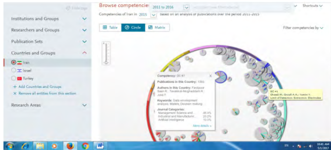
شکل ۲. نمایش دایره‌ای شایستگی‌های پژوهشی ایران در سال ۲۰۱۵

شایستگی پژوهشی، در قالب‌های جدول، نقشه، یا ماتریس برای یک کشور یا مؤسسه ارائه می‌شود. شکل ۲، نمایش دایره‌ای شایستگی‌های پژوهشی ایران را نشان می‌دهد.