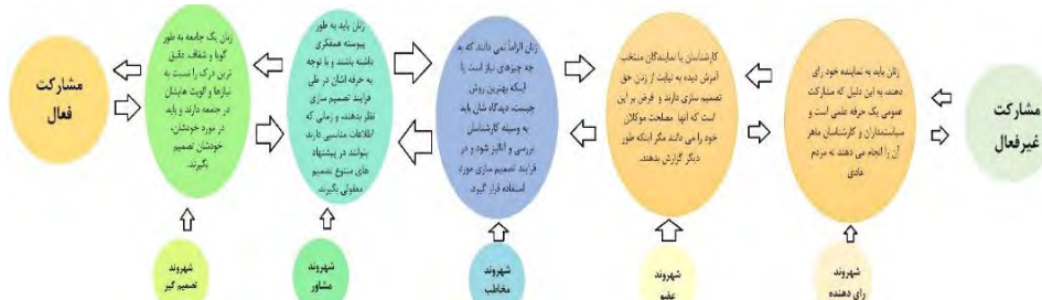
شکل ۱- نقش های زنان در حوزه ی مشارکت پذیری

تضاد نتایج را از پیش تعیین نماید. طرفین باید در جهت شناخت نقاط مشترک و یافتن راه های کاهش ناسازگاری ها به تبادل اطلاعات بپردازند (Hague et al., 2003; Harris, 2002)