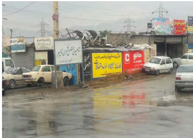
شکل ۲: ورودی نایسر؛ تراکم فعالیت‌های فنی و ریختن زباله‌ها در اطراف خیابان