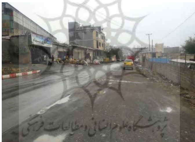
شکل ۳: ورودی نایسر؛ تراکم زباله‌های صنعتی