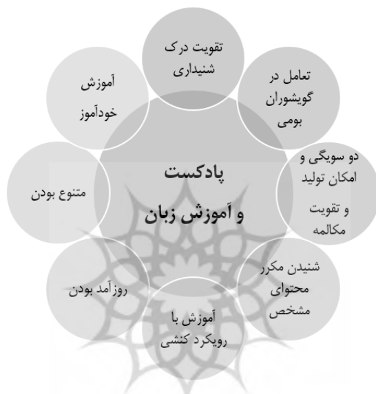
نمودار ۱. قابلیت‌های پادکست در آموزش زبان

ویژگی به زبان‌آموزان امکان می‌دهد که پادکست تولید کنند و پادکست‌های خود را به اشتراک بگذارند. این امکان نه تنها به تقویت درک شنیداری کمک می‌کند، بلکه به تصحیح تلفظ نیز می‌انجامد. تولید گزارش، مصاحبه و یا گفتگو در قالب پروژه تعامل زبان‌آموزان را با یکدیگر افزایش می‌دهد و در واقع شنونده را به گوینده و گوینده را به شنونده تبدیل می‌کند (Schatz, 2006: 20).