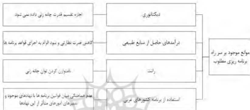
شکل ۲. موانع موجود بر سر راه برنامه‌ریزی مطلوب

نهادهای غیررسمی آنها شکل گرفته است، با واقعیات موجود در کشور ما مطابقت نداشته و در نتیجه دستاوردها، متفاوت از کشورهای غربی خواهد بود. موانع ذکر شده، در شکل زیر به‌طور خلاصه آورده شده است: