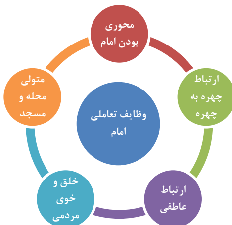
نمودار ۲- وظایف تعاملی امام جماعت