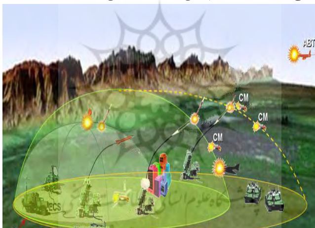
شکل ۲: گسترش سامانه سلاح دفاع هوایی چندلایه

به‌منظور مطالعه‌ی روش‌های تخصیص سلاح، چهار سامانه‌ی سلاح اصلی مد نظر قرار گرفته‌اند. (۴ و ۵) سامانه‌ی سلاح دفاع هوایی برد بلند، سامانه‌ی سلاح دفاع هوایی برد متوسط، سامانه‌ی سلاح دفاع هوایی برد کوتاه و یک سامانه‌ی لیزر که یک سپر دفاعی چندلایه را تشکیل می‌دهند. خصوصیات و توان‌مندی یک سامانه‌ی سلاح منفرد در مقابل موشک کروز، موشک بدون هدایت و هوایما، در جدول شماره ۱ درج شده است. تخصیص سلاح یکی از مسئولیت‌های اصلی سامانه‌ی فرماندهی و کنترل می‌باشد. همیشه این سؤال وجود دارد که چه ترکیبی از سلاح‌ها باید برای درگیر شدن با هدف مورد استفاده قرار گیرند. به‌منظور حداکثر نمودن قدرت نابودکنندگی در دفاع هوایی و با در نظر داشتن رعایت اصل صرفه‌جویی امکانات در هنگام دفاع، تخصیص سلاح ایده‌آل، یک ضرورت قطعی است.