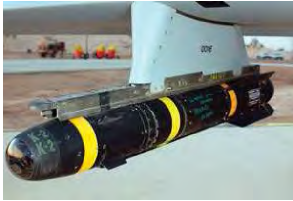
شکل (۲) موشک HELL FIRE AGM-114

در ماه مارس ۲۰۰۳، پهپاد پریدیتور یک موشک هوا به هوا از نوع استینگر را به سمت یک هواپیمای میگ عراقی، قبل از آنکه هواپیمای فوق بتواند آنرا سرنگون سازد، شلیک کرد. این امر باعث ایجاد این فکر جدید شد که پهپادهای ضربتی مسلح حتی می‌توانند در عملیات‌های ضد هوایی هم نقشی بر عهده گیرند (حتی شاید هم در آینده به عنوان جنگنده‌های برتر هوایی باشند). در کشور ج.ا. ایران نیز علاوه بر پهپادهای شناسایی، پهپادهای رزمی از دو نوع انتحاری و نوع بمب‌افکن تولید می‌شود که این صنعت رو به رشد است.