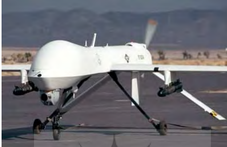
شکل (۱) پهپاد پریدیتور

رویارویی با نیروهای فرامنطقه‌ای با استفاده از هواپیماهای بدون سرنشین ..... ۲۵ تعویض دوربین های متعدد پهپاد RQ-1 یا همان پریدیتور با یک سامانه هدف یابی پیشرفته به نام MTS و مجهز کردن آن به دو موشک هل فایر آن را به یک مبارز اتوماتیک در خط مقدم جنگ تبدیل کرده است.