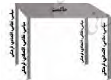
مدل حاکمیت در کشورهای توسعه یافته

توسعه یافته با کشورهای در حال توسعه و یا توسعه نیافته دارد این است که در کشورهای توسعه یافته این مولفه ها در هم تنیده اند یعنی در هر چهار ستون، مولفه های اقتصادی سیاسی، نظامی و فرهنگی وجود دارد ولی در