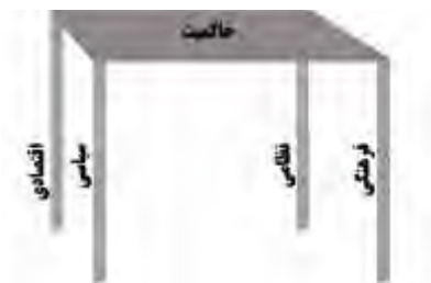
مدل حاکمیت در حال توسعه

امروزه در کشورهای در حال توسعه اگرچه همچنان ستون نظامی از اهمیت فوق العاده ای برخوردار است ولی مولفه های اقتصادی و سیاسی و فرهنگی نیز به عنوان