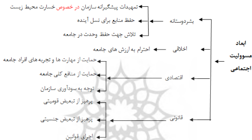
نمودار ۱. مدل مفهومی پژوهش برگرفته از نظریه کارول

با استناد به مبانی نظری، مدل مفهومی پژوهش با توجه به ابعاد و مؤلفه های اثرگذار در حوزه مسوولیت اجتماعی به شرح زیر تدوین می شود. مدل مذکور با توجه به کامل بودن مدل کارول برگرفته از این دو نظریه پرداز است. با استفاده از این مدل و نتایج محقق ساخته مدل مطلوب مسوولیت اجتماعی در سازمان تأمین اجتماعی طراحی گردید.