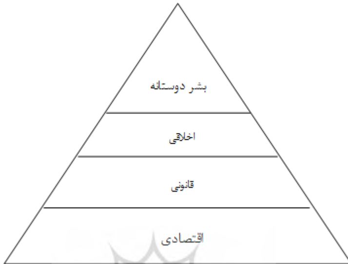
شکل ۱. مدل هریمی کارول

محیط زیست به عنوان یکی از ابعاد مسوولیت اجتماعی تا آنجا مورد اهمیت قرار گرفته که در سال ۱۹۶۰ در کنفرانس «بایوسفر» پاریس به عنوان یک اصل «توسعه پایدار» معرفی گردید (Pettrini, 2017, P. 105).