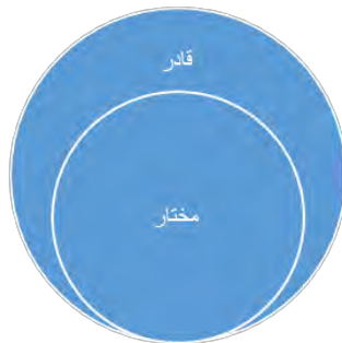
شکل ۱. رابطه قادر و مختار از نظر امام خمینی علیه السلام

امام خمینی علیه السلام معتقد است: اختیار ترجیح یکی از دو طرف فعل و ترک، بر مبنای حسن و قبح عقلی است؛ بنابراین از منظر ایشان، قدرت و اختیار دو تعریف متفاوت و متمایز از هم دارند. توضیح آنکه ممکن است شما قدرت نداشته باشید، اما اختیار داشته باشید؛ مثلاً شما می‌خواهید یک وسیله بخرید و قدرت خرید آن را هم دارید؛ پس اگر قدرت داشته باشید، اختیار هم دارید؛ اما اگر اختیار داشته باشید، به این معنا نیست که قدرت هم دارید؛ چراکه ممکن است شما بخواهید وسیله‌ای بخرید، اما قدرت خرید آن را نداشته باشید. بنابراین در هر دو حالت، شما مختارید؛ اما در یک حالت قدرت دارید و قادر هستید و در یک حالت، گرچه مختارید، قادر نیستید. به عبارت دیگر، رابطه قدرت و اختیار، عموم و خصوص مطلق است: هر کس قدرت دارد، مختار است؛ اما برخی از مختارها قدرت ندارند و برخی دیگر قدرت دارند. شاید به همین سبب باشد که امام قدرت و اختیار را در برخی مواقع به جای هم به کار برده است (به عنوان نمونه ر.ک: موسوی خمینی، ۱۳۸۵، ج ۱۴، ص ۱۶). در شکل شماره ۱ رابطه قادر و مختار نشان داده شده است.