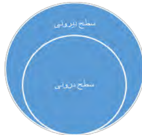
شکل ۱: نسبت سطوح برنامه درسی هم افزا

«عموم و خصوص مطلق» هستند؛ یعنی وجه بیرونی در بردارنده وجه درونی هم هست (شکل ۱).