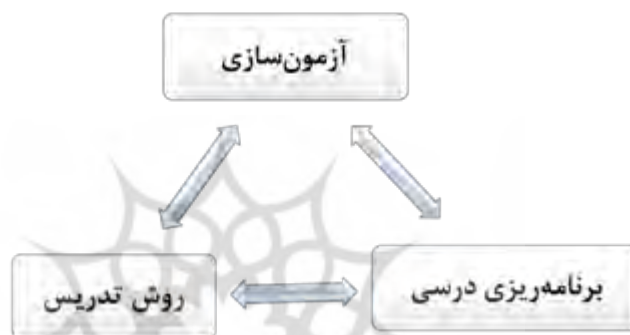
شکل ۱. مثلث آموزش زبان دوم / خارجی

آموزش زبان دوم / خارجی یک حرفه تخصصی است که سه بخش اصلی و کلیدی دارد: روش تدریس ۱ ، برنامه‌ریزی درسی ۲ و آزمون‌سازی ۳ . این سه بخش با یکدیگر رابطه فرایندی و چرخه‌ای دارند و به مثابه سه ضلع یک مثلث هستند که آموزش زبان دوم / خارجی بر آنها استوار می‌گردد.