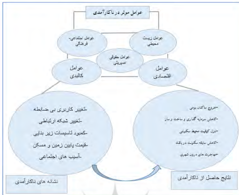
شکل ۱. عوامل موثر در ناکارآمدی بافت های شهری.