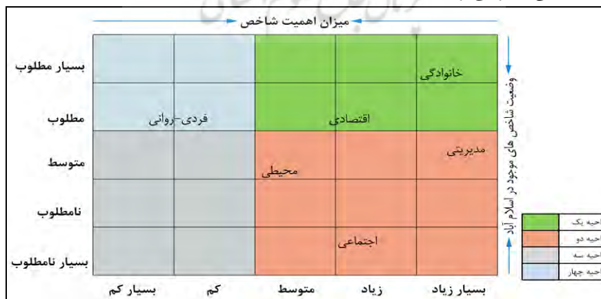
شکل ۳- تحلیل نهایی میزان اهمیت و وضعیت موجود شاخص‌های آسیب‌های اجتماعی محله اسلام‌آباد با مدل ANP (مأخذ: یافته‌های تحقیق،

ناحیه شماره دو، به شاخص‌هایی اختصاص دارد که علیرغم اهمیت بالایی که در تأثیرگذاری بر آسیب‌های اجتماعی محله اسلام‌آباد شهر زنجان دارند، از وضعیت مناسب برخوردار نیستند. در این زمینه، مؤلفه‌های مدیریتی، اجتماعی و محیطی در ناحیه دو قرار دارد. این وضعیت نشان می‌دهد که ۵۰ درصد شاخص‌ها در این ناحیه قرار دارد در نتیجه تأثیر متوسطی بر آسیب‌های اجتماعی دارند. اما نمی‌توان ریشه آسیب‌های اجتماعی محله را در این شاخص‌ها جستجو کرد. چرا که شاخص‌های این ناحیه، ضریب تأثیر واسطه‌ای داشته، و به نوعی عوامل رونمایی هستند. در ناحیه سوم هیچ شاخصی قرار نگرفته است. اما در ناحیه چهارم، شاخص فردی-روانی قرار دارد. اصولاً، شاخص‌هایی در ناحیه چهارم قرار می‌گیرند که از اهمیت کم و بسیار کم برخوردار هستند و بیشتر تأثیرپذیرند. لذا به نظر می‌رسد، بر اساس وزنی نمونه آماری و ضریب همبستگی با دیگر شاخص‌ها، شاخص فردی-روانی، غالباً از آسیب‌های اجتماعی تأثیر می‌پذیرد و به واسطه گسترش آسیب‌های اجتماعی در محله اسلام‌آباد، مؤلفه‌های فردی و روانی ساکنین محله، به شدت آسیب‌دیده، و به تقویت بیشتر آسیب‌های اجتماعی منجر می‌گردد.