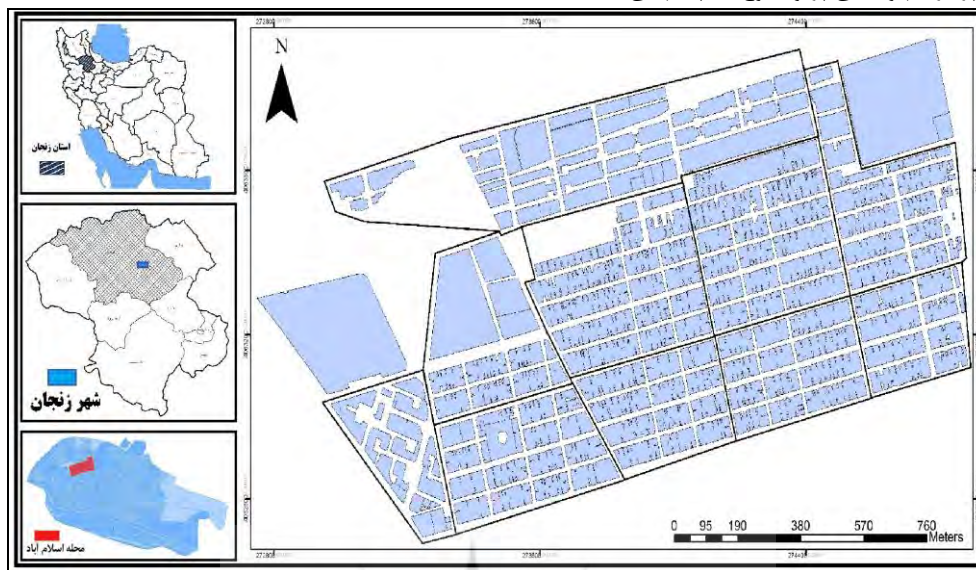
شکل ۱- موقعیت محله اسلام آباد در شهر زنجان و کشور- ترسیم: نگارندگان، ۱۳۹۷.

از جمعیت شهر را در خود جای داده است. محله اسلام آباد امروزه با ساخت و سازهای صورت گرفته شده در شمال آن مانند شکل گیری کوی فرهنگ (علی آباد) و الهیه و شهرک جدید صدرا کاملاً در داخل شهر قرار گرفته است و از نظر کالبدی در حاشیه شهر قرار ندارد ولی همواره با چشم اندازی پر تراکم و بافتی پر و شلوغ به چشم می زند (Daviran et al, 2011 : 120).