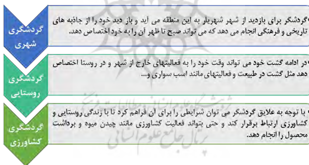
شکل شماره ۱. رابطه اجزای مبانی نظری پژوهش

نخست، گردشگری کشاورزی به گردشگران این فرصت را می‌دهد که در فرایند تولید مواد غذایی مشارکت نمایند. دوم، به گردشگران فرصت می‌دهد تا بیشتر درباره زندگی مردم روستایی بدانند. سوم این‌که گردشگری کشاورزی به گردشگران این فرصت را ارائه می‌دهد تا با حیوانات اهلی و دشت و صحرا (که جزئی از تجربه و زندگی روزمره آن‌ها نیست) تماس مستقیم داشته باشند. این سه ویژگی با سه اصل گردشگری کشاورزی همراه است. این سه اصل بیان می‌کند که در یک مقصد گردشگری باید: چیزی برای گردشگران وجود داشته باشد تا بازدید کنند (مثلاً حیوانات، مزارع، فرهنگ و سنن روستایی، جشنواره‌ها). کاری برای گردشگران وجود داشته باشد تا انجام دهند (مثلاً مشارکت در ماهیگیری، آشپزی، برداشت محصول و مشارکت در بازی‌های محلی) و وسیله برای گردشگران وجود داشته باشد تا بخرند (مثلاً صنایع دستی روستایی، سبزی‌های تازه و مواد غذایی فراوری شده در مزرعه) (sznajder et al, 2009: 260).