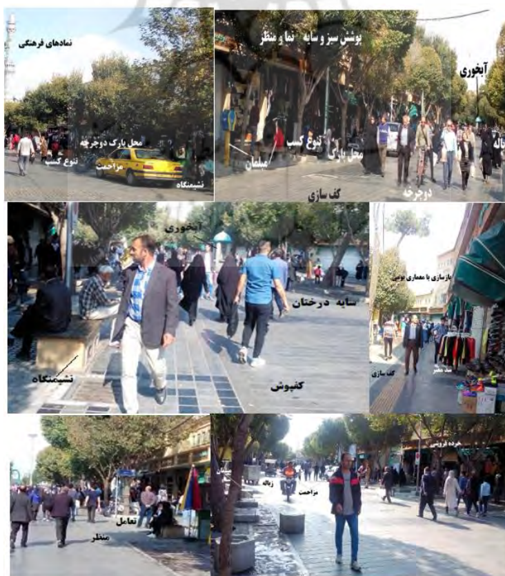
شکل شماره ۲. نمایی از وضعیت کالبدی پیاده راه حرم

«کف‌سازی مناسب» متغیر بعدی است. با اجرای طرح پوشش کف پیاده راه از حدود ۵ سال پیش، این معبر سنگفرش و تسطیح شده است. با این وجود، ورود وسایل نقلیه سنگین سبب شکستگی، شکاف و نشست کف‌پوش‌ها در جای‌جای مسیر گردیده که ضمن تأثیرگذاری منفی بر هدایت هرز آب‌ها، ترمیم آن‌ها هم‌مخوان با طرح اولیه نیست. امکان «پارک دوچرخه و صندلی چرخ‌دار» در چند گوشه فراهم است و به این لحاظ در ارزیابی‌ها، این متغیر در مرتبه هفتم قرار گرفته است. «تنوع در کسب‌وکارها» در آمار شمارش پیش‌گفته روشن است. «شکل‌گیری تعاملات اجتماعی» متغیری است که در نتایج، در ردیف نهم قرار دارد. این پیاده راه به‌نوعی میعادگاه اصلی طیف وسیعی از اقشار جامعه است که برای گپ و گفت و ملاقات، حضور می‌یابند و در ساعت‌های فعالیت، در گوشه و کنار آن، گفت‌وگوشنود و تعاملات نمایان است. به لحاظ «دسترس‌پذیری» این پیاده راه علاوه بر برخورداری از مرکزیت تقریباً هندسی در منطقه، ارتباط با آن از طریق ۵ خط اتوبوس‌رانی میسر بوده و بسیاری از خطوط تاکسی‌رانی نیز بدان می‌رسند. سه خیابان منتهی به این معبر، شاه‌رگ‌های ارتباطی شهرری با تهران و سکونتگاه‌های پیرامون محسوب می‌شوند. به لحاظ متغیر «کیفیت خدمات (آبخوری، شیر آب، دستشویی، تلفن همگانی، سطل زباله)» بنا به شمارش انجام‌شده توسط پژوهشگران، در ۶ نقطه آب‌سردکن و سقاخانه برای نوشیدن آب، در ۲۸ نقطه سطل زباله، و در ۵ نقطه تلفن همگانی قرار داده‌شده و امکان استفاده از دستشویی و شیر آب حداکثر در فاصله ۵۰۰ متری وجود دارد. همچنین به لحاظ «وجود صندلی و نشیمنگاه»، ملازم با طرح کف‌سازی، ۳۸ صندلی با ظرفیت سه نفر در جای‌جای پیاده راه قرار داده‌شده است.