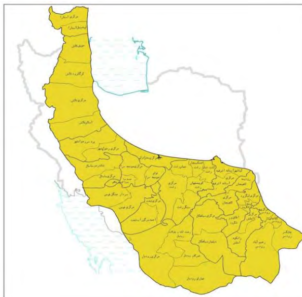
شکل ۱. تقسیمات اداری استان گیلان بر حسب بخش قرارگیری بخش‌های استان گیلان