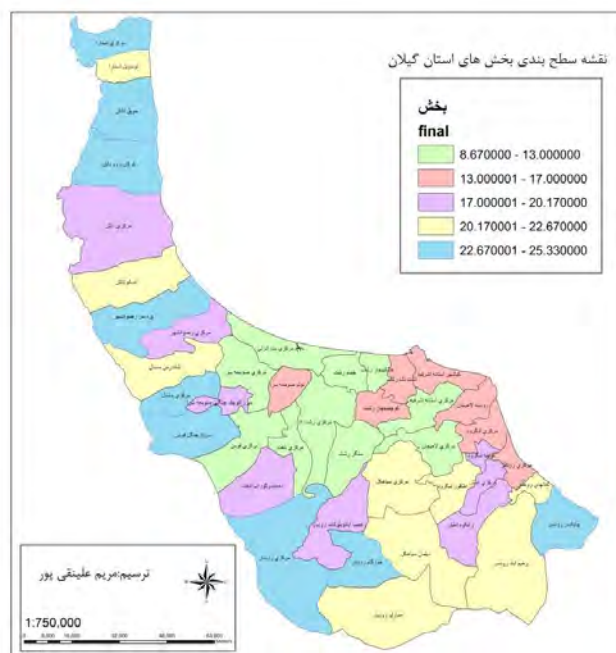
شکل ۲. نقشه سطح بندی بخش‌های استان گیلان

در شکل ۲ وضعیت فضایی سطوح برخورداری بخش‌ها به خوبی نشان داده شده است و بخش‌های همگن در هر گروه سطح بندی به تفکیک دیده می‌شود که می‌تواند برای برنامه‌ریزان توسعه در استان مفید باشد. با توجه به شکل ۲ بخش‌های استان گیلان از نظر اولویت بندی سطوح برخورداری به پنج گروه تقسیم شده‌اند (جدول ۳). در خاتمه به مقایسه سطح توسعه یافتگی بخش‌ها در فاصله سال‌های ۱۳۸۵ و ۱۳۹۰ پرداخته می‌شود. در این بخش از تکنیک تاپسیس استفاده می‌شود. پس از اینکه رتبه بخش‌ها با استفاده از این تکنیک محاسبه شد، برای مقایسه بهتر ضریب تغییرات به دست می‌آید. از ضریب تغییرات برای سنجش اینکه تا چه حد یک شاخص به طور نامتعادل در بین مناطق توزیع شده است استفاده می‌شود. به عبارت دیگر، از ضریب تغییرات برای بررسی روند نابرابری موجود در شاخص‌های توسعه در بین نواحی و در سطوح وسیع استفاده می‌شود و مقدار بالای آن بیانگر نابرابری بیشتر است. این ضریب از تقسیم انحراف معیار بر میانگین به دست می‌آید (جدول ۴).