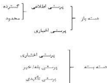
شکل ۳. انواع سؤال‌های مورد استفاده در فرایند بازجویی

از دیگر یافته‌های پژوهش، حاضر می‌توان به قرارگیری پرسشی‌های اخباری در رده پرسشی‌های باز اشاره داشت که در بسیاری از مطالعات در رده پرسشی‌های بسته قرار می‌گیرند و به طبع، در پیوستار میزان کنترل‌کنندگی نیز در مرحله پایین‌تر یعنی میزان کنترل‌کنندگی کمتر نسبت به سایر پرسش‌ها قرار می‌گیرند. در نهایت، نیز نگارندگان دسته‌بندی زیر از پرسش‌های مورد استفاده در فرایند بازجویی در دادسرا و نیز پیوستار میزان کنترل‌کنندگی را به صورت زیر ارائه می‌دهند: