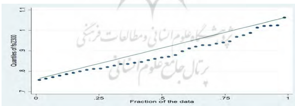
شکل ۲- نمودار پراکندگی شاخص FSI با استاندارد ۲۳۰۰ کالری با توجه به چندک‌های گوناگون